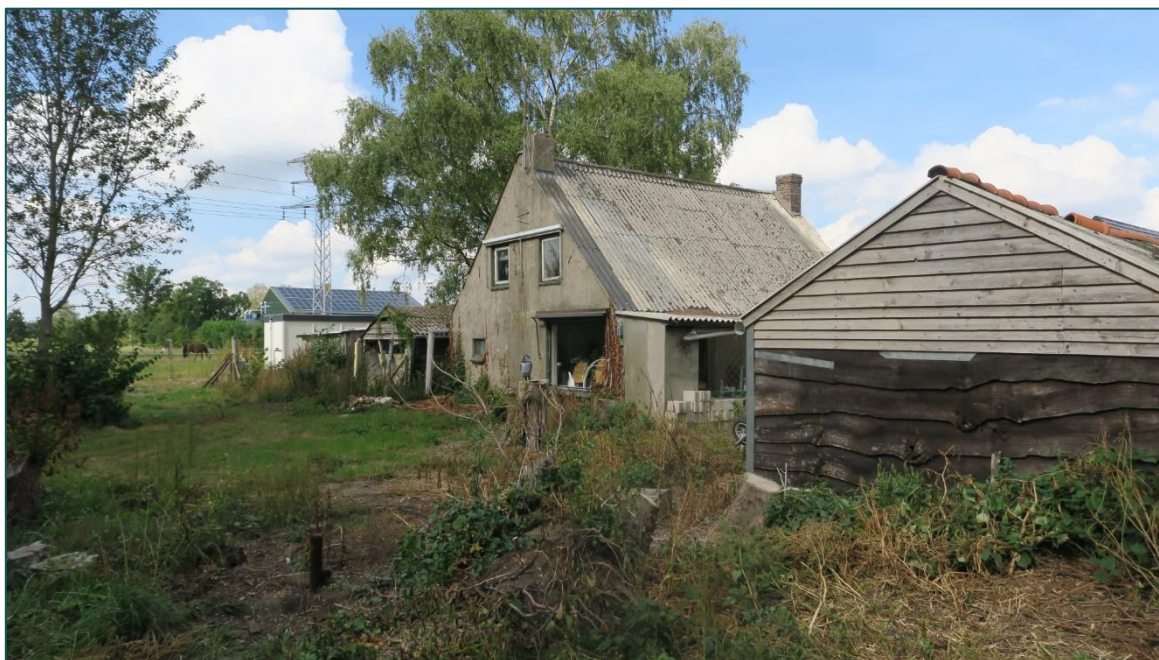
Figuur 1.1 De planlocatie is gelegen aan de Scharrenburgerweg 30a te Lunteren.