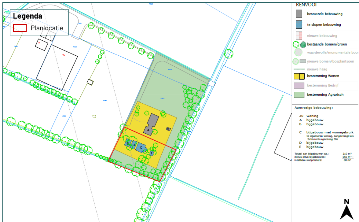
Figuur 1.2 De planlocatie (rood omkaderd) is gelegen aan de Scharrenburgerweg 30a te Lunteren (Bewerkt. Origineel: Architectenbureau DBL Lunteren).

De planlocatie is gelegen aan de Scharrenburgerweg 30a te Lunteren (figuur 1.2). De planlocatie bestaat uit een woonhuis welke momenteel niet meer bewoond wordt, twee kleine schuren en een overkapping. De woning (C) (welke gedeeltelijk ook een schuur betreft) is opgebouwd uit gemetselde muren zonder spouw. Het dak bestaat uit golfplaten met -alleen ter hoogte van de woning- dakbeschot. De schuren en overkapping (E, D en F) bestaan alle uit een enkele laag planken/houten platen en een golfplaten dakbedekking. Er is momenteel een tijdelijke woonunit op het terrein aanwezig welke bewoond wordt. De planlocatie is geheel onverhard. Er is geen oppervlaktewater aanwezig. Van de aanwezige bomen (Figuur 1.2) zijn reeds enkele exemplaren gekapt. Twee overgebleven exemplaren zullen uiteindelijk ook gekapt worden. In figuur 1.3 en bijlage 1 zijn een aantal foto's opgenomen die een impressie geven van de planlocatie en de directe omgeving hiervan.