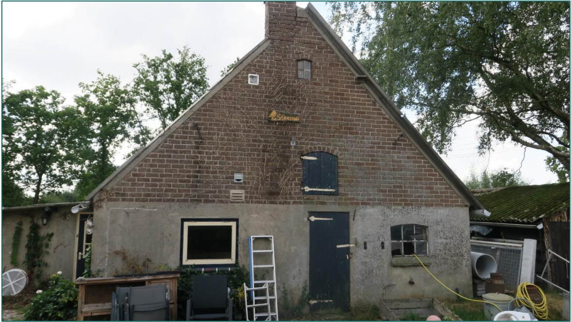
Figuur 1.3 Op de planlocatie is men voornemens om onder andere het woonhuis (deels schuur) te slopen.