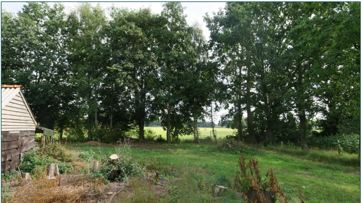
Figuur 4 De bomenrij op de grens van de planlocatie en de Meulunterense beek worden niet aangetast.