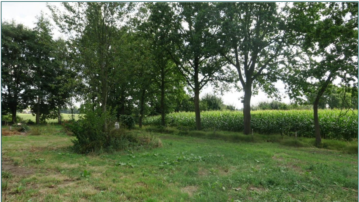
Figuur 1.4 Fotografische indruk van de omgeving van de planlocatie.