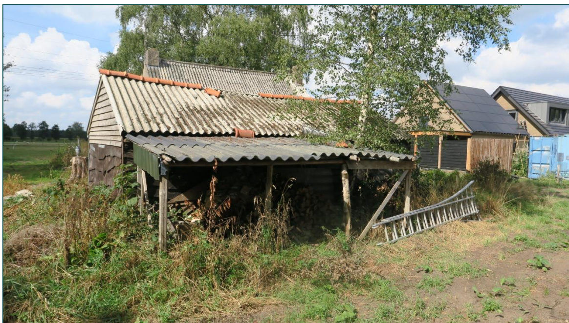
Figuur 1 De planlocatie is gelegen aan de Scharrenburgerweg 30a te Lunteren en bestaat uit meerdere schuren en een woonhuis. De beoogde ruimtelijke ingreep betreft de sloop van alle bebouwing en de bouw van een nieuwe woning en bijgebouw.