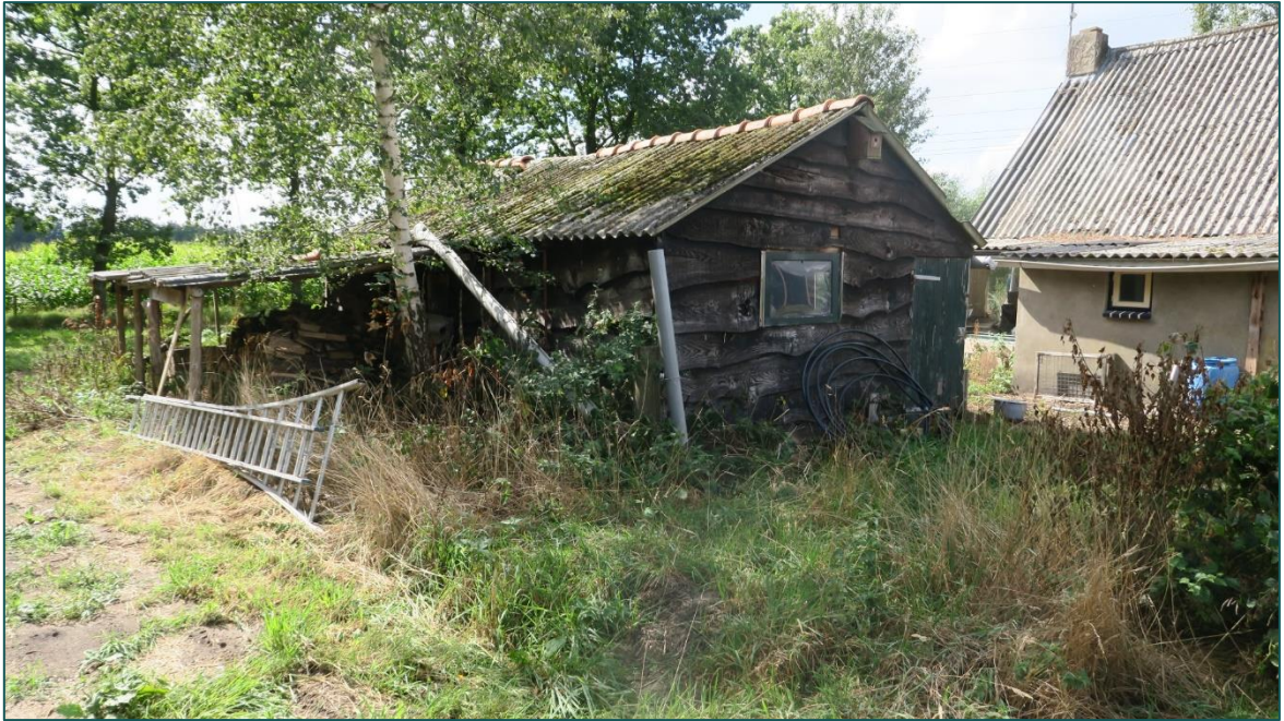
Figuur 3 Overzicht van schuur F.