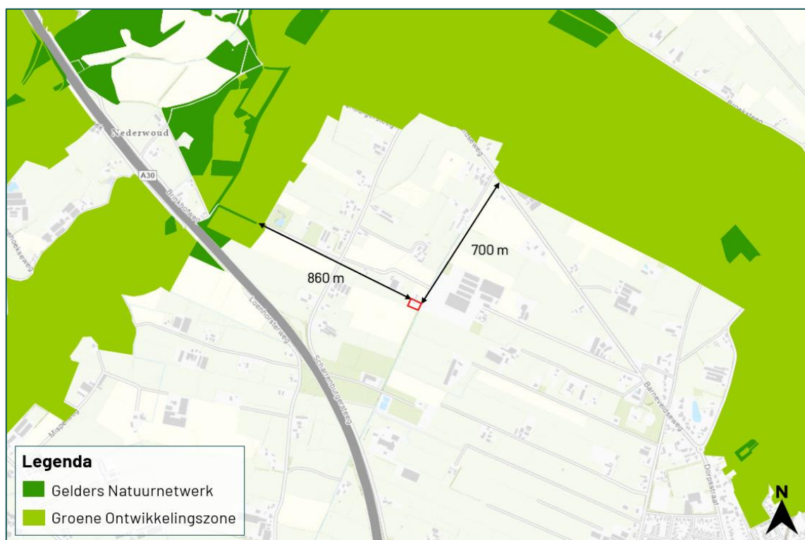
Figuur 3.2 De planlocatie ligt op een afstand van circa 700 m tot het Gelders Natuurnetwerk en op circa 860 m tot de Groene Ontwikkelingszone

De planlocatie maakt geen deel uit van een beschermd gebied betreffende het Gelders Natuurnetwerk, Groene Ontwikkelingszone, Weidevogelgebied, Ganzenrustgebied of Beschermingszone natte landnatuur. Op een afstand van circa 860 m ligt het Gelders Natuurnetwerk en op een afstand van circa 700 m ligt de Groene Ontwikkelingszone (figuur 3.2). Op een afstand van circa 15 km ligt Weidevogelgebied (geen kaartweergave). Ganzenrustgebied is gelegen op een afstand van circa 15 km van de planlocatie (geen kaartweergave). Op een afstand van circa 6 km ligt de Beschermingszone natte landnatuur (geen kaartweergave). Ten aanzien van provinciaal aangewezen gebieden geldt dat externe werking geen toetsingskader is.