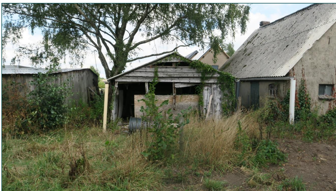
Figuur 2 Overzicht van de achterzijde van overkapping E, schuur D en woonhuis E.