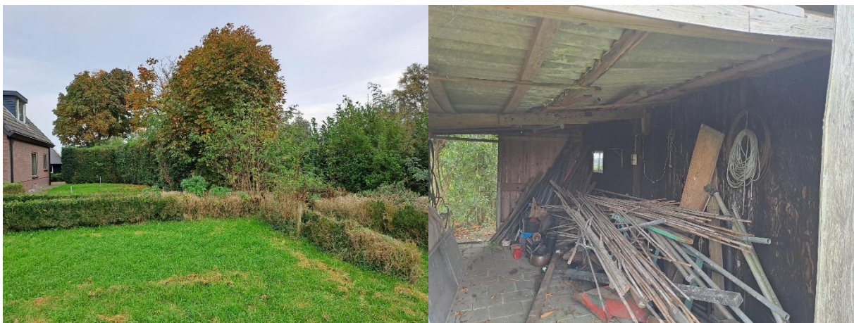
Amfibieën kunnen een (winter)rustplaats bezetten onder strooisel en bladeren en onder opgeslagen spullen/materialen in de schuur.

Tijdens het veldbezoek zijn geen amfibieën waargenomen, maar gelet op de inrichting en het gevoerde beheer, wordt het plangebied als functioneel leefgebied voor sommige algemene en weinig kritische amfibieënsoorten beschouwd. Amfibieën als bruine kikker en gewone pad benutten het plangebied als foerageergebied en mogelijk bezetten ze er een (winter)rustplaats. Deze soorten kunnen een (winter)rustplaats bezetten in holen gaten in de grond, onder strooisel en bladeren en onder opgeslagen spullen/materialen in de aanbouw. De aanbouw is toegankelijk voor amfibieën, maar de schuur niet. De schuur is voor amfibieën toegankelijk. Agrarisch cultuurland vormt geen functioneel leefgebied voor amfibieën. Het plangebied wordt niet als functioneel leefgebied van zeldzame amfibieënsoorten als kamsalamander, rugstreeppad of poelkikker beschouwd. Geschikt voortplantingsbiotoop ontbreekt in het plangebied.