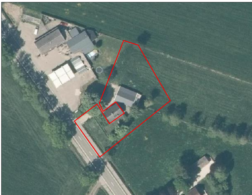
Begrenzing van het onderzoeksgebied; deze wordt met rode lijn aangeduid.

Omdat er geen werkzaamheden uitgevoerd worden aan de woning, is deze niet meegenomen in het onderzoek. Indien in dit rapport gesproken wordt over plangebied wordt onderstaand onderzoeksgebied bedoeld.