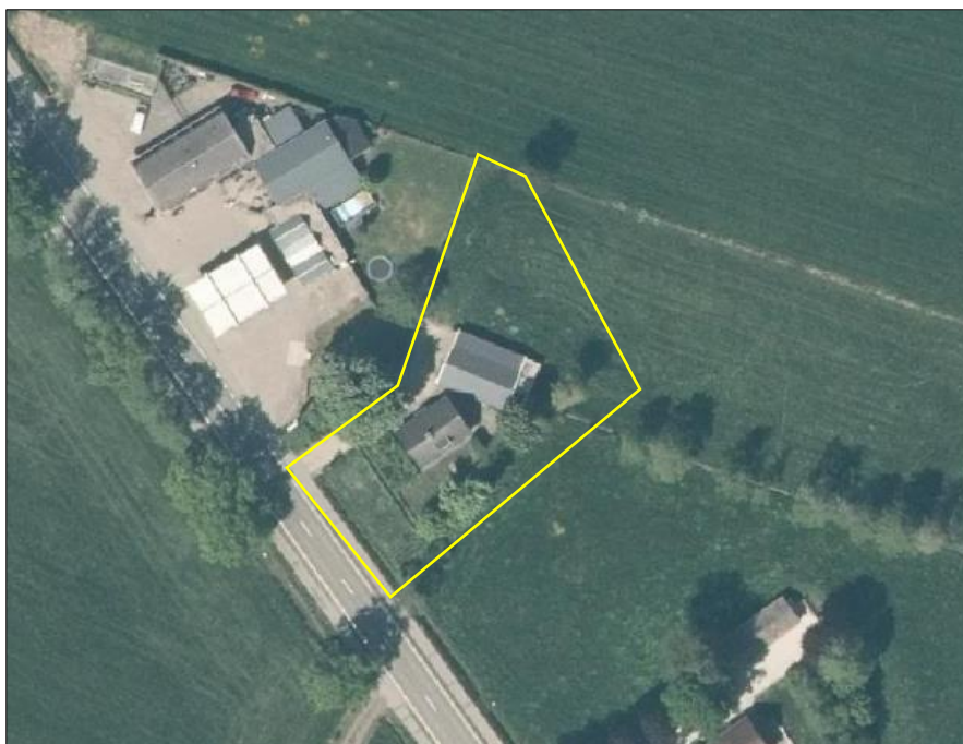
Begrenzing van het plangebied; deze wordt met de gele lijn aangeduid.

Het plangebied vormt een woonerf en bestaat uit bebouwing, beplanting, agrarisch cultuurland en erfverharding. De bebouwing bestaat uit een woning en een schuur met aanbouw. De woning beschikt over gemetselde buitengevels met luchtsponw en over een dakpannen gedekt zadeldak met dakisolatie. De schuur met aanbouw is volledig van hout en is gedekt met golf- of damwandplaten. In de aanbouw liggen spullen/materialen opgeslagen (o.a. planken, oud ijzer en stokken). Rondom de woning ligt een eenvoudige siertuin bestaande uit sierplanten, heesters, scheerhagen en enkele loofbomen. Het agrarisch cultuurland, tijdens het veldbezoek in gebruik als grasland, bestaat uit soortenarme vegetatie van raaigras en wordt intensief beheerd (bemesten, maaien en afvoeren maaisel). Op onderstaande luchtfoto is de begrenzing van het plangebied aangegeven. Voor een impressie van het plangebied wordt verwezen naar de fotobijlage.