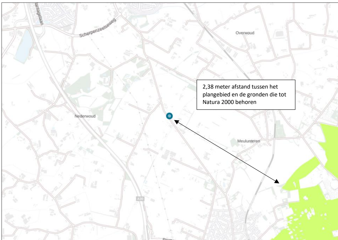
Ligging van Natura 2000-gebied in de omgeving van het plangebied. De ligging van het plangebied wordt met de blauwe marker aangeduid. Gronden die tot Natura 2000 behoren worden met de lichtgroene kleur aangeduid.

Het plangebied ligt op minimaal 2,38 kilometer afstand van Nederlands Natura 2000-gebied. Het meest nabij gelegen Natura 2000-gebied, is Veluwe. Op onderstaande afbeelding wordt de ligging van het Natura 2000-gebied in de omgeving van het plangebied weergegeven.