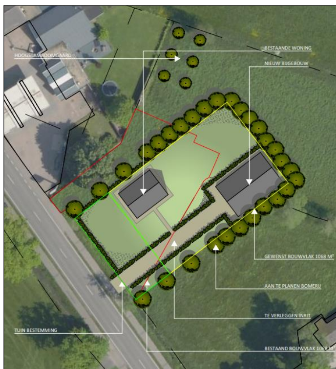
Verbeelding van het wenselijk eindbeeld (bron: VanWestreenen).

Het voornemen bestaat om een nieuw bijgebouw in het plangebied te realiseren en het bouwvlak te vergroten. Om het nieuwe bijgebouw te realiseren dient de bestaande schuur met aanbouw gesloopt te worden. De woning blijft behouden. Het erf wordt d.m.v. een nieuw aan te leggen verharde inrit in verbinding gebracht met de Barneveldseweg. Langs deze inrit worden laanbomen aangeplant. Aangenomen wordt dat alle aanwezige beplanting verwijderd wordt. Tevens wordt aangenomen dat een deel van de bestaande erfverharding verwijderd en vervangen wordt en dat er nieuwe erfverharding wordt aangelegd. Het erf wordt nadien landschappelijk ingepast, middels aanplant van erfbeplanting, laanbomen en een hoogstam boomgaard. Op onderstaande afbeelding is een plattegrond van het wenselijk eindbeeld weergegeven.