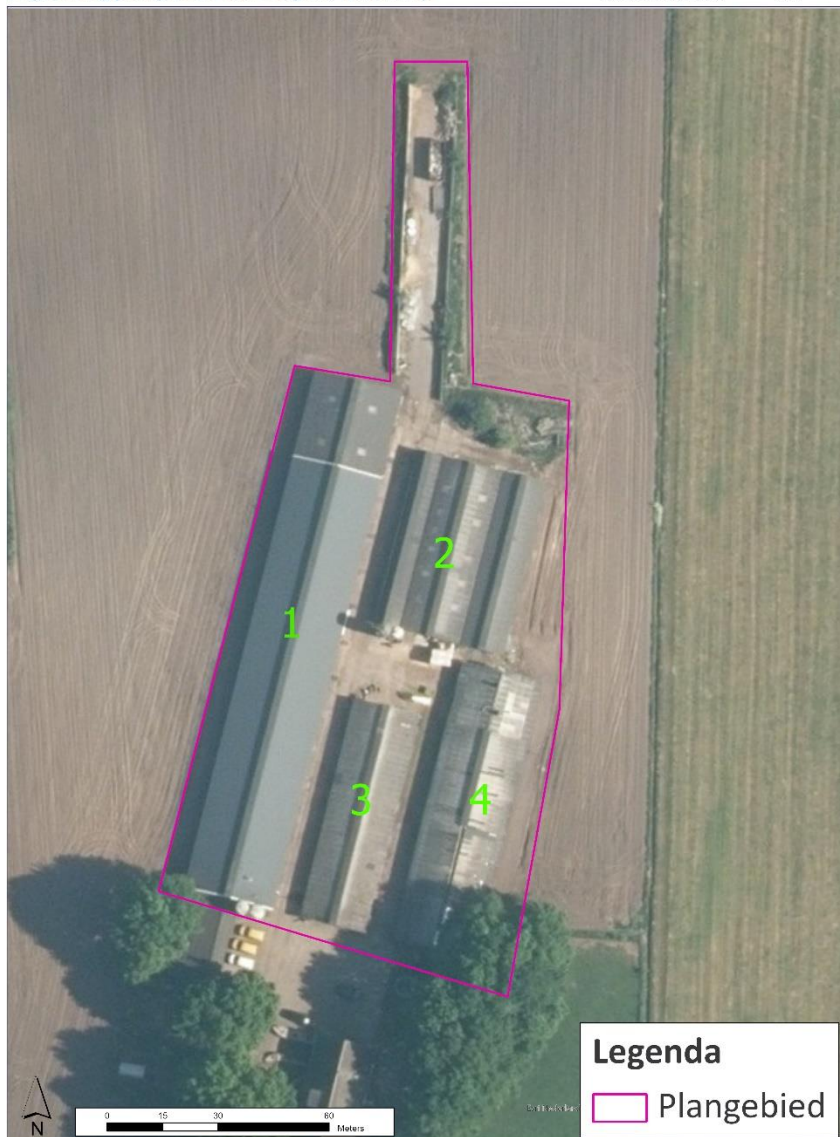
Afbeelding 1: Luchtfoto plangebied, met nummering van schuren. (Esri, Luchtfoto)