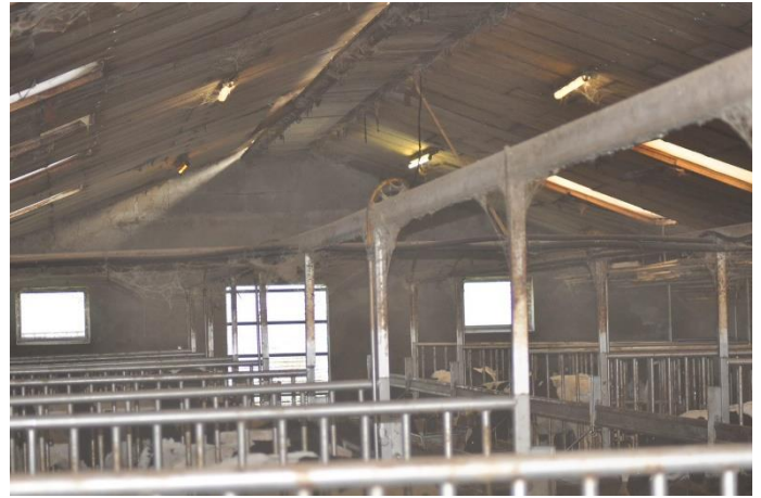
Afbeelding 2b: Impressie plangebied op 15/02/2023