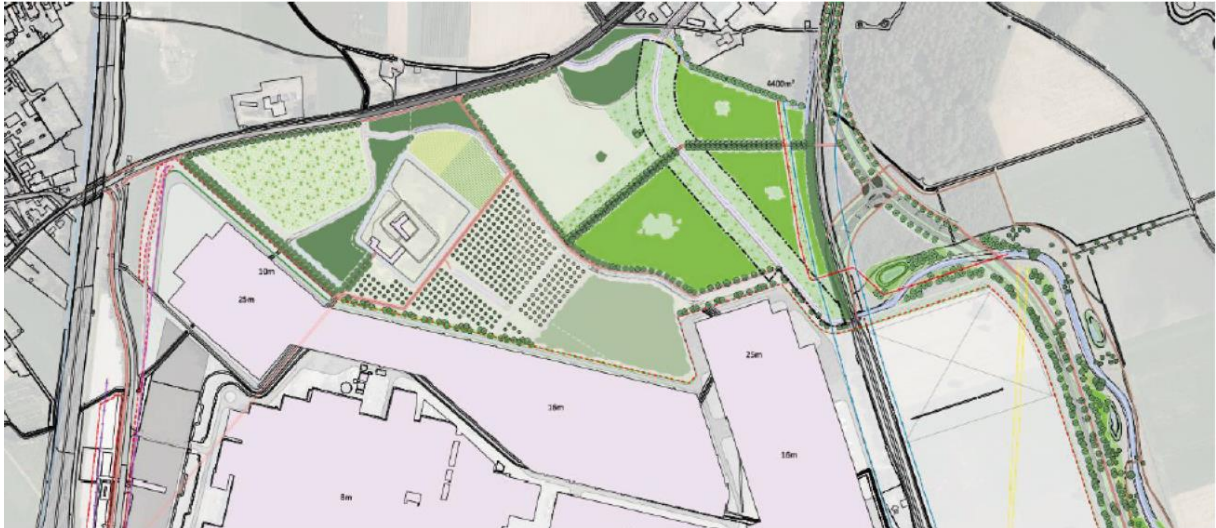
Figuur 1.2: totaal overzicht landschappelijke maatregelen noordzijde