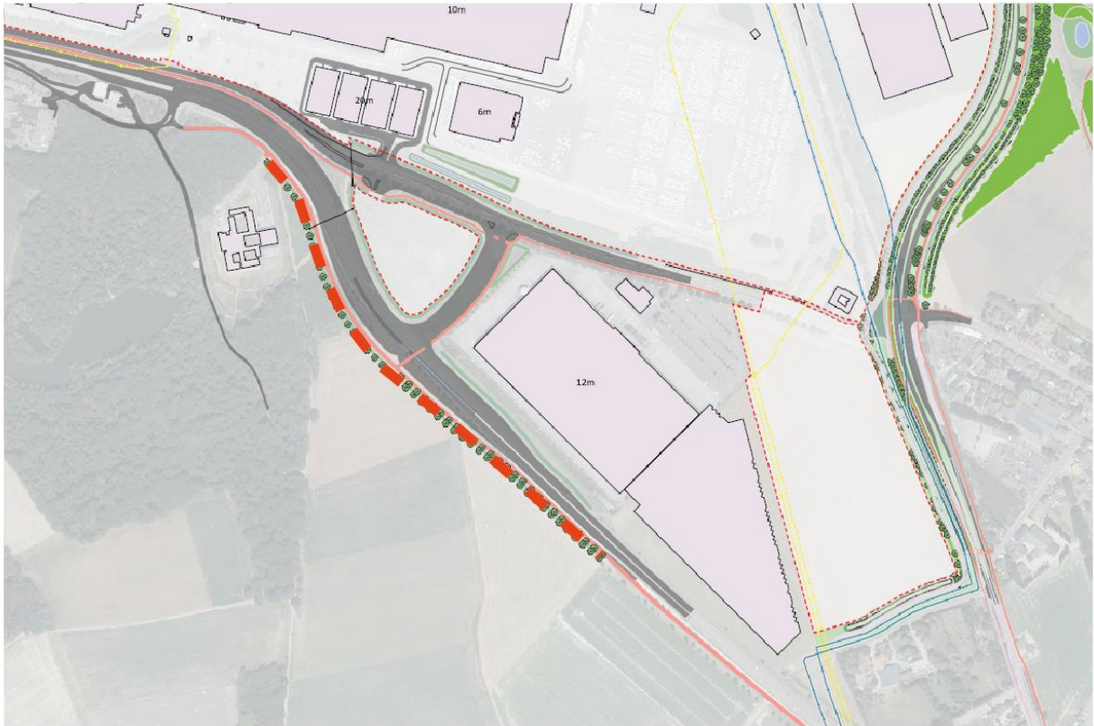
Figuur 1.13: locatie bomenlaan (rode lijn)