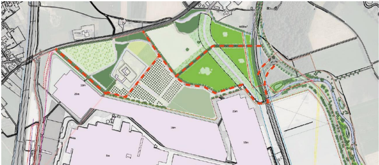
Figuur 1.3: locaties fietspad (rode lijn)