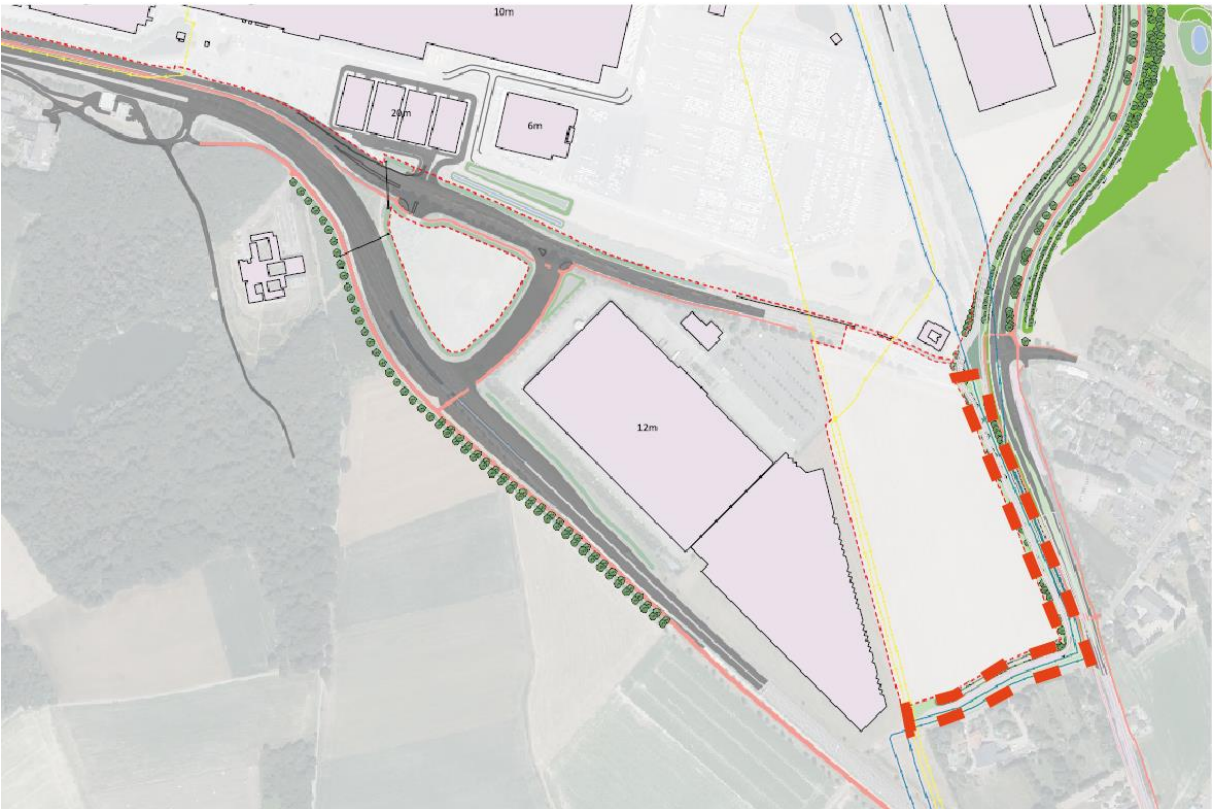
Figuur 1.14: locatie inpassing rondom traileryard (rood omlijnd)