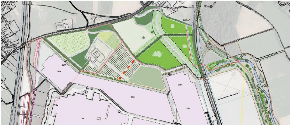
Figuur 1.6: locatie watergang