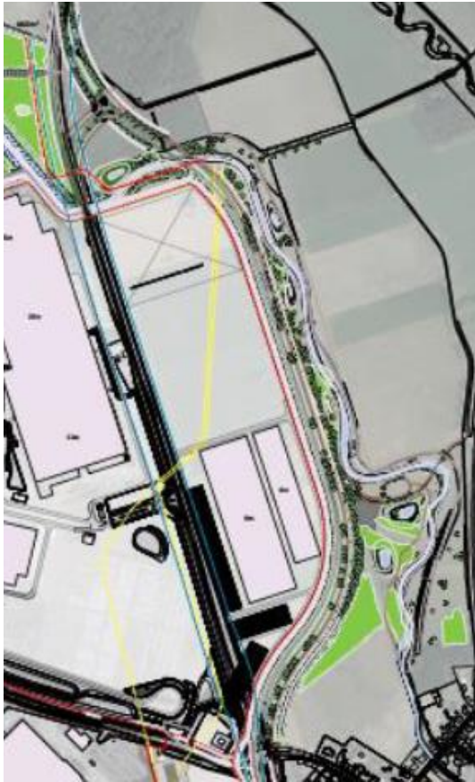
Figuur 1.9: totaal overzicht landschappelijke maatregelen oostzijde