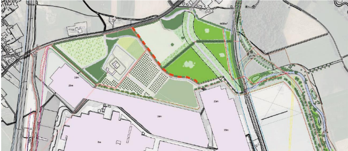
Figuur 1.8: locatie beplanting Jonkheer G. Ruijs de Beerenbroucklaan (rode lijn)