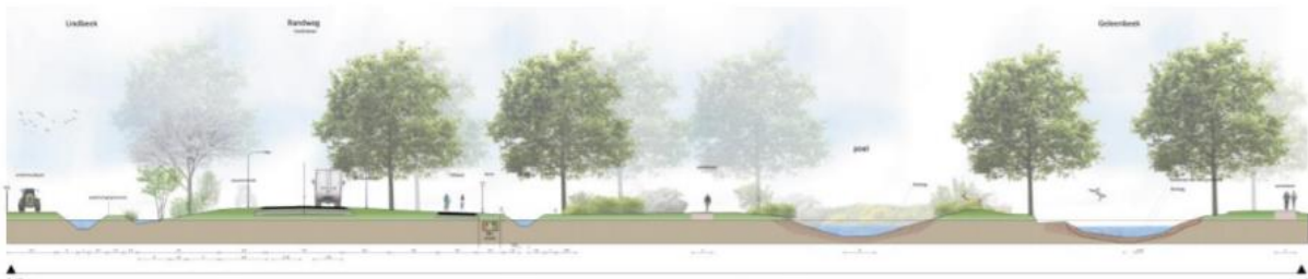
Figuur 1.10: profiel VDL Nedcar – randweg – Geleenbeek - Nieuwstadt