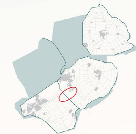
Poldercarré van beplanting, grens landbouwhart Zuidelijk Flevoland