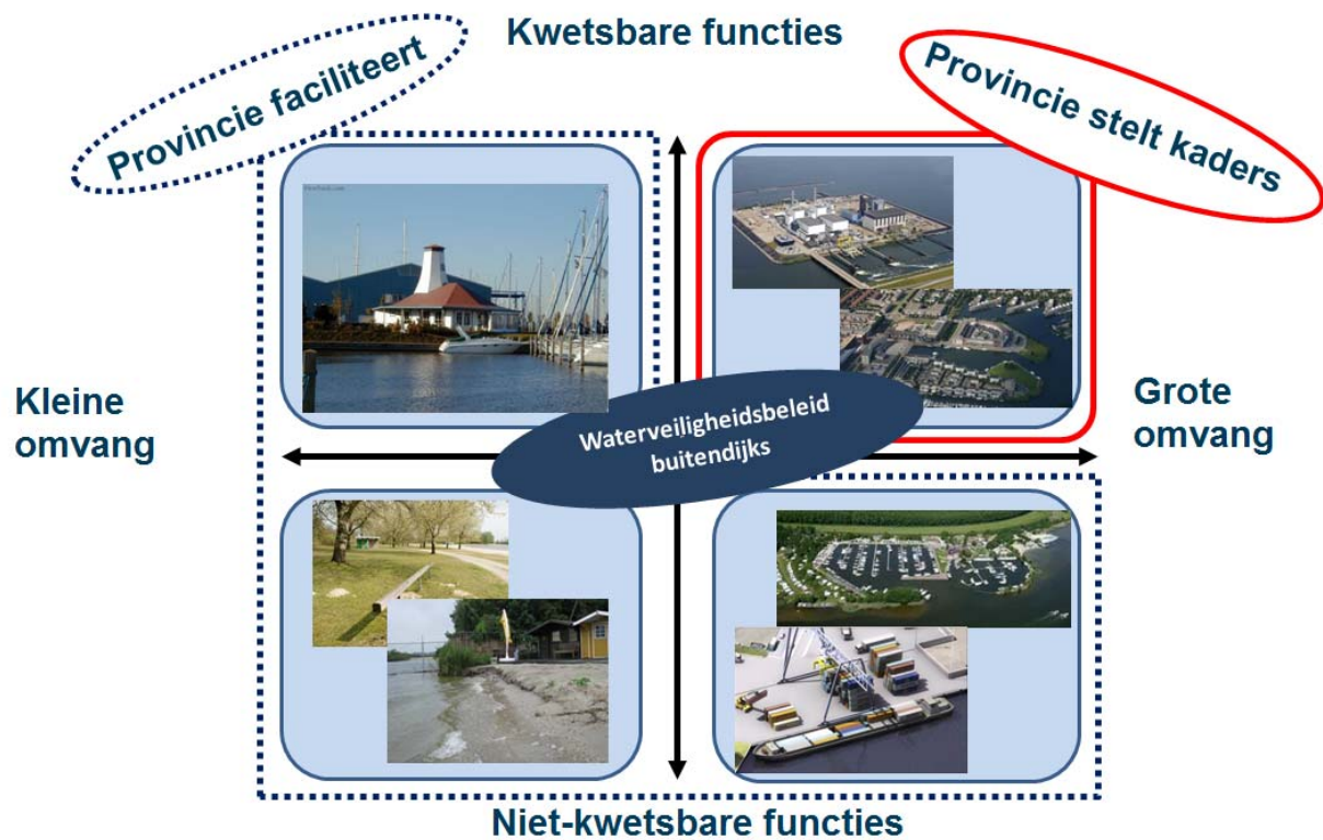
Figuur 3: provinciaal belang

De provincie maakt onderscheid tussen buitendijkse ontwikkelingen met én zonder een provinciaal belang. Dit onderscheid spitst zich met name toe op de omvang en de functies in deze buitendijkse gebieden. In onderstaand kwadrant is dit schematisch in beeld gebracht.