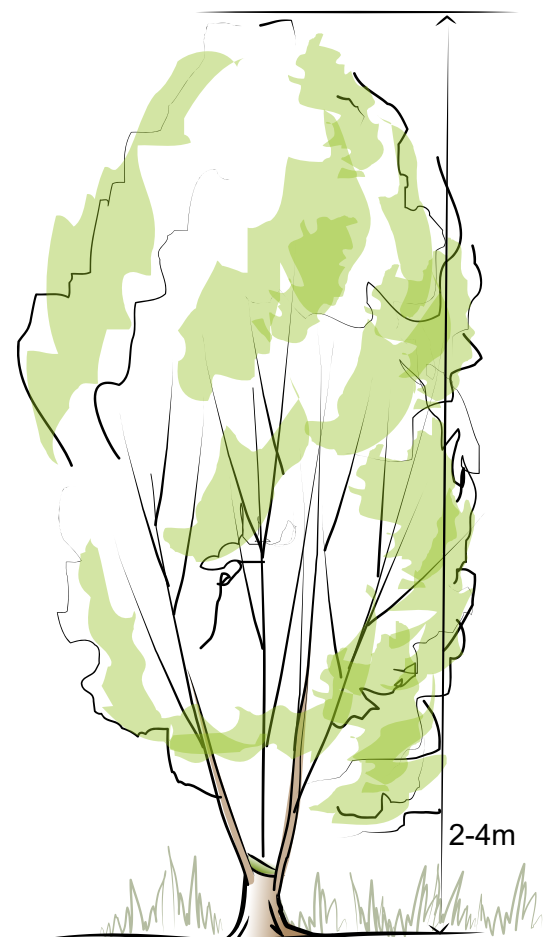
4-5 jaar na afzetten