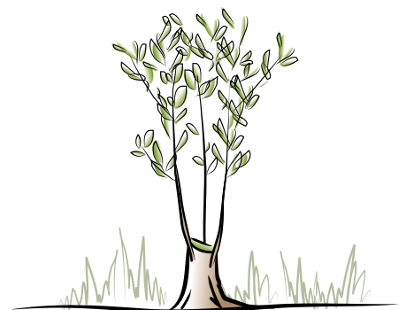
2 jaar na afzetten