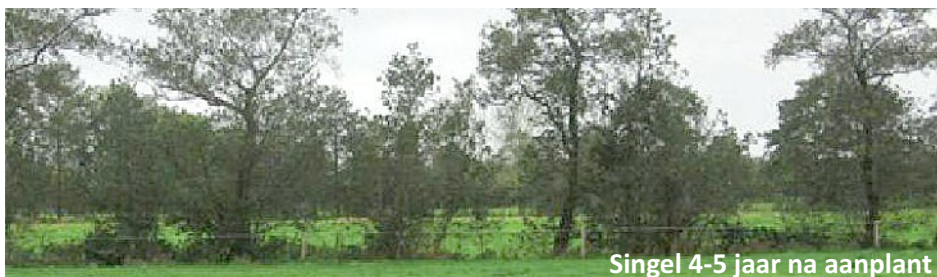
Singel 4-5 jaar na aanplant