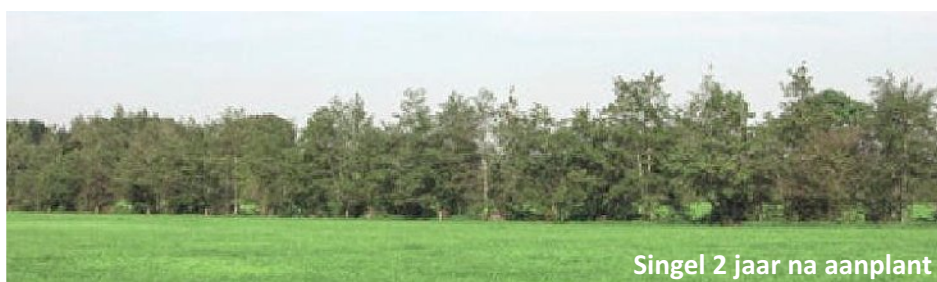
Singel 2 jaar na aanplant