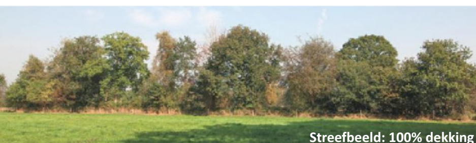
Streefbeeld: 100% dekking