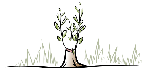
1e jaar na afzetten