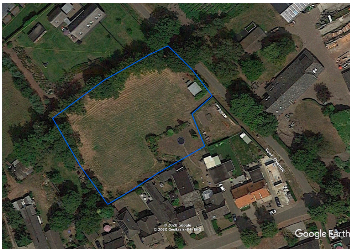
Afbeelding 1: ligging plangebied blauw

Bebouwing of watervoerende structuren ontbreken op de planlocatie. Men is voornemens woningbouw te realiseren op de locatie.