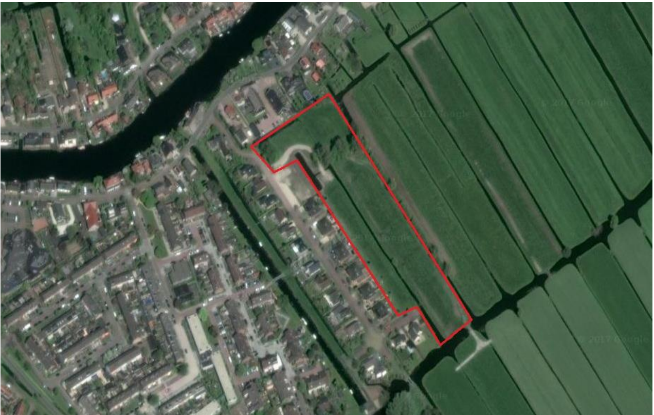
Figuur 4.1.1. Het plangebied (rood omlijnd).

Het plangebied (zie figuur 4.1.1 en de foto's op de voorkant van dit rapport) ligt aan de oostkant van Giessenburg. Het omvat een perceel van circa 1850 m 2 en bestaat momenteel uit weiland (met soorten als Engels raaigras, ridderzuring, paardenbloem, vogelmuur, grote brandnetel, zachte ooievaarsbek etc.), sloten een klein bosje met o.a. zwarte populier, treurwilg en Spaanse aak. In de slotjes groeien soorten als kroosvaren, liesgras, puntkroos, sterrenkroos en waterzuring. Aan de oostzijde bevindt zich een rij knotwilgen, direct naast een verhard paadje (zie figuur 4.1.2). In en rond het plangebied bevinden veensloten (zie figuur 4.1.3). De noord- en westzijde van het perceel worden begrensd door een rij nieuwbouwwoningen. De overige zijdes van het plangebied grenzen aan weilanden met soortgelijke slotjes.