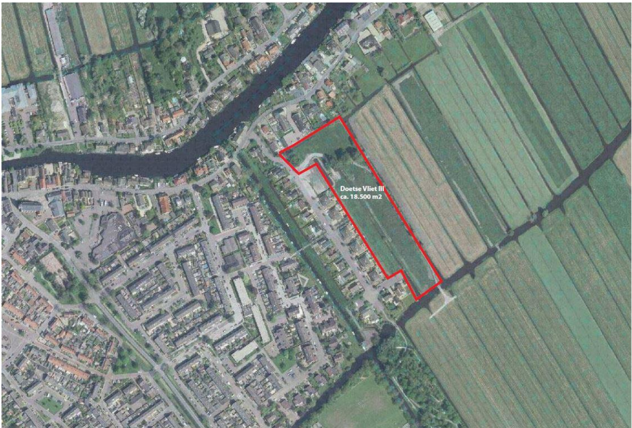
Figuur 1.1. De planlocatie (rood omlijnd).

In opdracht van Ordito Gilze heeft Aeres Milieu in samenwerking met Faunaconsult een quickscan natuurwetgeving uitgevoerd aan de Doetse Vliet in Giessenburg (Gemeente Giessenlanden, Provincie Zuid-Holland), zie figuur 1.1. Op deze locatie is momenteel een weiland met slootjes en enkele bomen aanwezig. Hier zal een nieuwbouwwijk worden gerealiseerd met 31 woningen met wegen, groen en het nodige water.