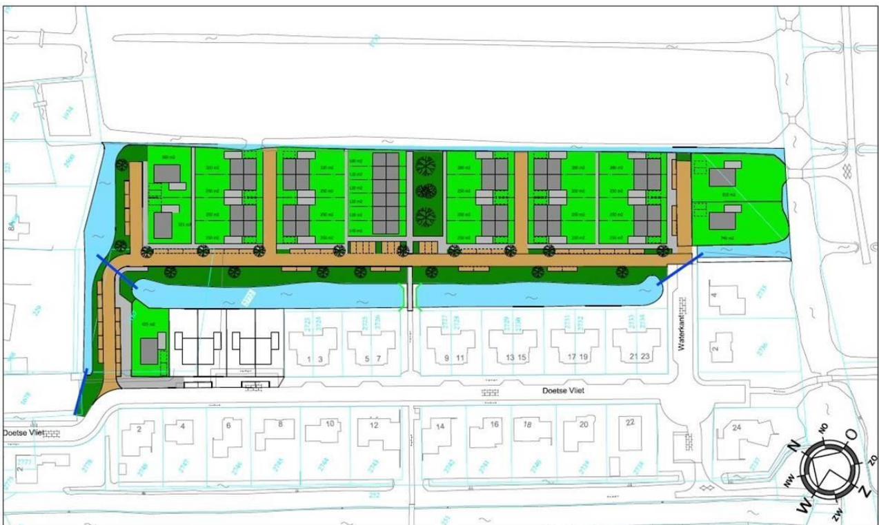
Figuur 3.1.1. De voorgestane situatie.

De bomen worden verwijderd, een van de sloten wordt verlegd en de weilanden worden omgevormd tot woonwijk (zie figuur 3.1.1). Hiertoe worden 31 woningen gebouwd en wegen, groen en wateren zullen worden aangelegd.