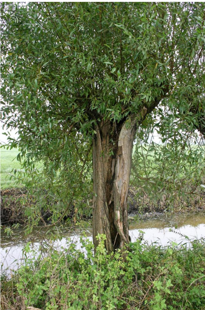
Figuur 4.5.1. Open gerotte wilg.

In de rij knotwilgen zijn geen holten aanwezig. Deels komt dit doordat een aantal wilgen volledig is open gerot (zie figuur 4.5.1.). De in het plangebied aanwezige treurwilg bevat een klein spechtengat. Omdat boom bewonende vleermuizen doorgaans meerdere holle bomen nodig hebben die zich op een korte afstand van elkaar bevinden, is het niet waarschijnlijk dat er zich in deze holten vleermuisverblijven bevinden. Dit wordt bevestigd door het feit dat er geen vleermuisuitwerpselen onder het spechtengat aanwezig waren tijdens het veldbezoek. Het is uitgesloten dat er vleermuisverblijven, uilenverblijven etc. in het plangebied aanwezig zijn. De rij met knotwilgen ten oosten van het plangebied fungeert mogelijk wel als vaste vliegroute of foerageergebied voor vleermuizen. Omdat vaste vliegroutes en foerageergebieden van vleermuizen onder de Wet natuurbescherming als een vaste voortplantings- of rustplaats worden gezien, is een aantal vleermuissoorten in tabel 4.5 opgenomen. Dassenburchten of sporen van dassen zijn afwezig.