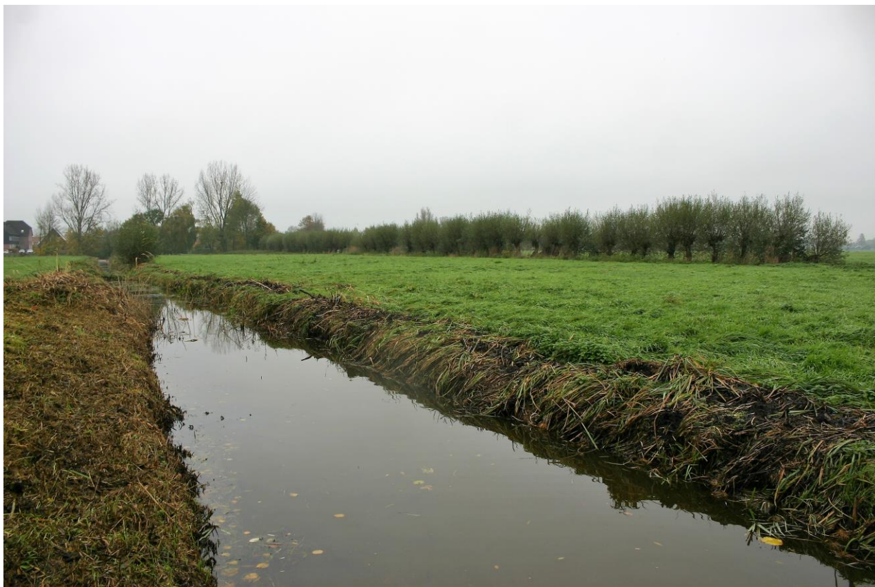
Figuur 4.1.3. Eén van de sloten in het plangebied.