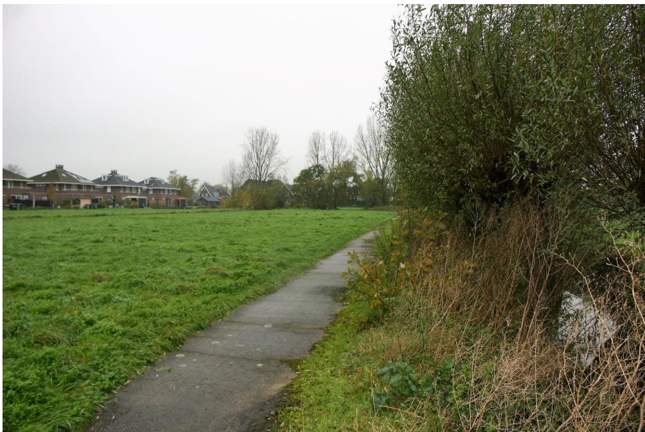
Figuur 4.1.2. De knotwilgenlaan en het verharde paadje in het plangebied