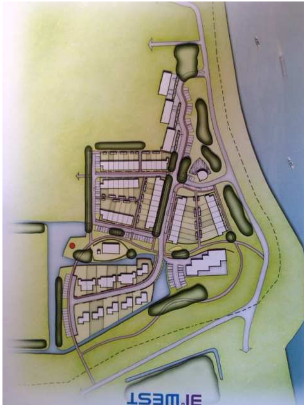
Figuur 1.2: Ontwerpschets bouwplan