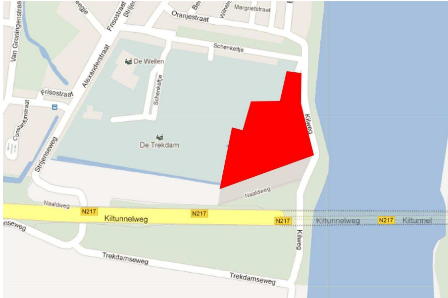
Figuur 1.1: Afbakening bouwplan Tuinzigt