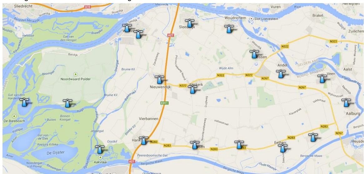
Figuur 3, Overzicht WAS-Installaties.

Binnen de bebouwde kom is er veel voldoende dekking van de WAS-installatie daarnaast is NL Alert operationeel voor vele mobiele telefoons. Voor de industriegebieden is Alert4All ontwikkeld en kunnen BRZO bedrijven de overige bedrijven bij incidenten alerteren. Bij ontwikkelingen buiten de bebouwde kom adviseren wij u na te gaan of de dekking voldoende is. In figuur 3 is een overzicht opgenomen van de dekking van de WAS-installatie in uw gemeente.