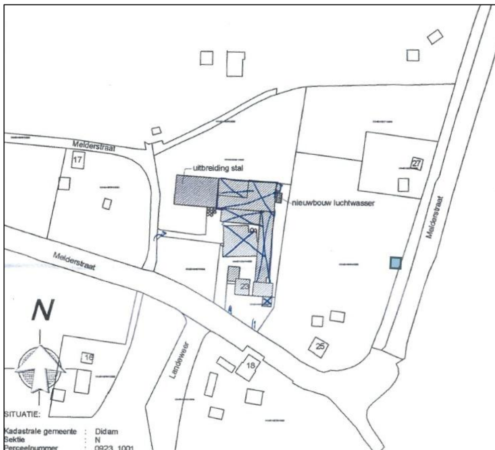
Afbeelding 4. Toekomstige situatie Melderstraat 23

Afbeelding 4 geeft de nieuwbouw op de locatie Melderstraat aan. De bestaande stallen worden gesloopt en vervangen door nieuwbouw. Verder komt er aan de westzijde van de bebouwing een stal bij.