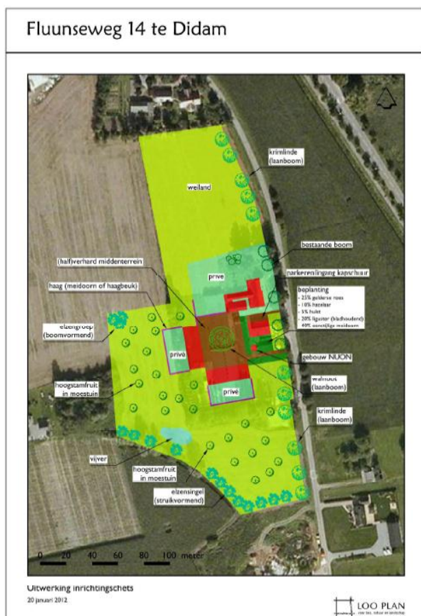
Afbeelding 13. Toekomstige situatie Fluunseweg

Uit het booronderzoek aan de Fluunseweg blijkt dat er deels sprake is van een dikke bruine eerdgrond. In deze eerdgrond zijn scherven van 20 e eeuws witgoed aanwezig en puinresten. Dit laatste wijst erop dat de grond tijdens de bouw van de stallen geroerd is. De akker geeft een ander beeld. Hier ontbreekt de dikke eerdlaag. Onder de bouwvoor ligt hier een bodemlaag waarin brokken klei aanwezig zijn die erop wijzen dat de akker gediëpplougd is. Op het maaiveld van de akker liggen scherven die afkomstig zijn van handgevormd aardewerk. Het is goed mogelijk dat materiaal van een vondstlaag door het diepploegen aan de oppervlakte is gekomen. De mogelijke vondstlaag zal daardoor niet meer intact zijn. Uit de toekomstige situatie blijkt dat de bebouwing zich rond de huidige bebouwing concentreert en dat daaromheen een (moes)tuin is voorzien (zie afbeelding 13).