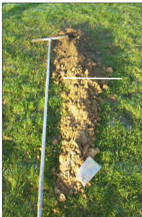
Afbeelding 10. Bodemopbouw Melderstraat boring 4 met boven de lijn de bouwvoor en bij de plastic zak de aangetroffen houtskool