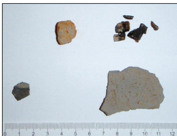
Afbeelding 11. Vondstmateriaal van vondstnummer 1 met boven de huttenleem en houtskool en onder het aardewerk