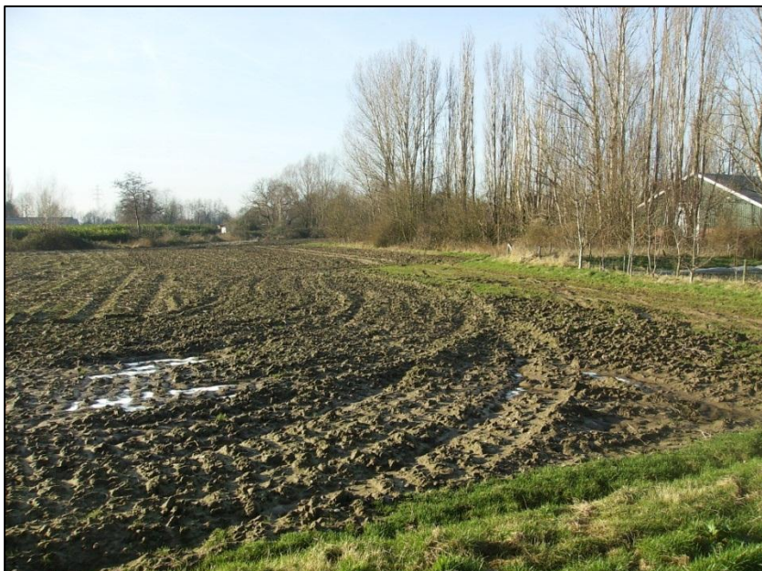
Afbeelding 7. De akker achter de huiskavel Fluunseweg 14