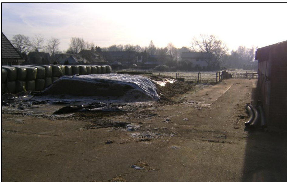
Afbeelding 12. Beeld van het onderzoeksterrein St. Isidorusstraat