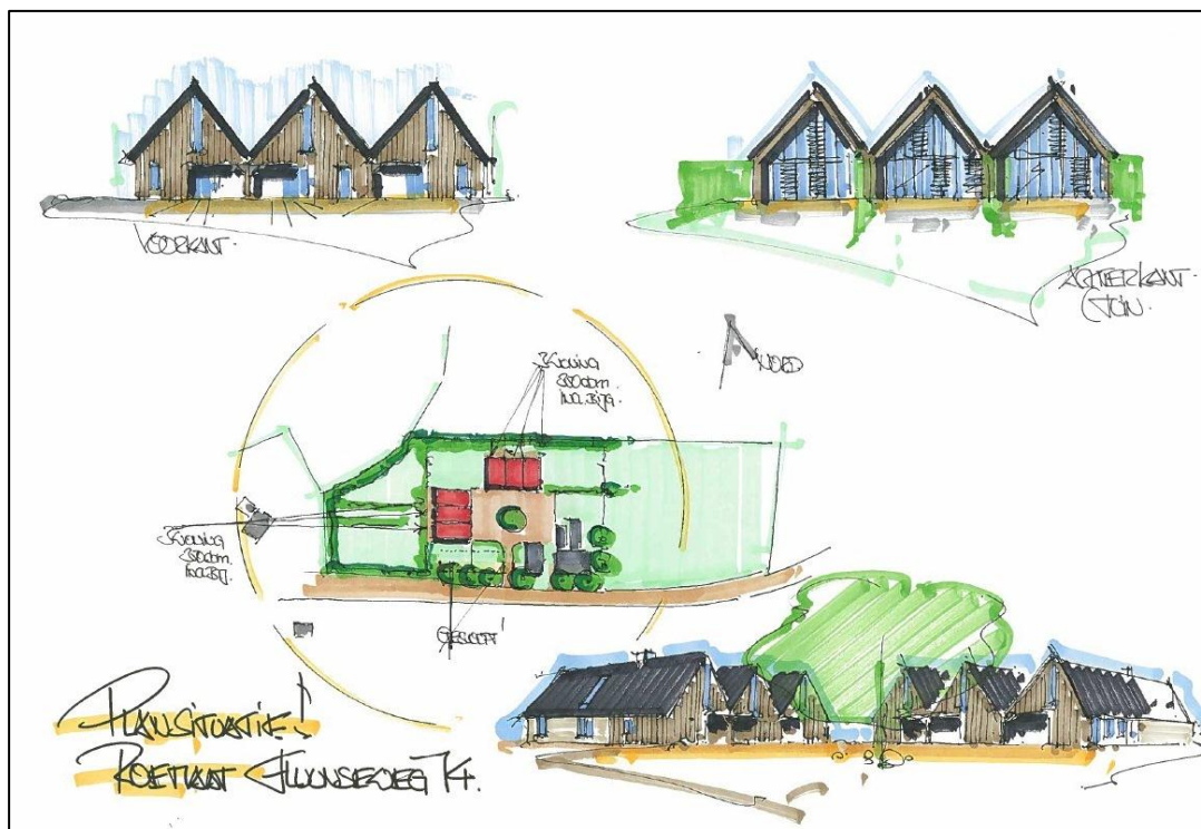
Afbeelding 3. Beeld van de voorgenomen nieuwbouw aan Fluunseweg 14

Op de locatie Fluunseweg worden de stallen gesloopt en vindt nieuwbouw plaats. Afbeelding 3 geeft een indruk van de nieuwbouw met centraal de geplande ligging van de woningen binnen het onderzoeksgebied.