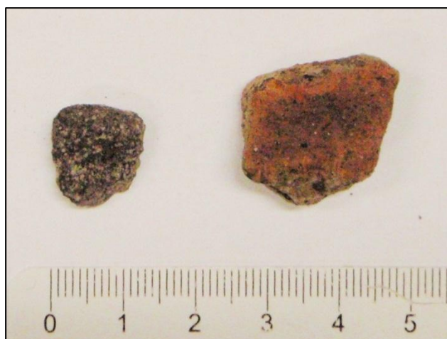
Afbeelding 8. Links handgevormd aardewerk van locatie 1 en rechts kogelpotaardewerk van locatie 4