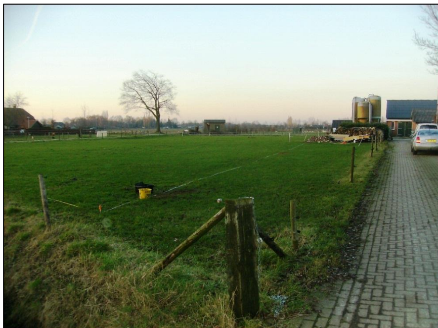
Afbeelding 9. Beeld van het onderzoeksgebied Melderstraat 23

Dit onderzoeksterrein bestaat uit een huiskavel en een naastgelegen strook weiland (zie afbeelding 9 en bijlage 5 ). De bodemopbouw bestaat hier uit een zandige bovengrond waarin een 40-60 cm dikke bouwvoor aanwezig is (zie afbeelding 11 en bijlage 2 voor de gedetailleerde beschrijving per boring). De dikte van de bouwvoor wijst erop dat er bodemkundig gesproken kan worden van een esdek of eerdgrond. Rond de 1 m-mv gaat de zandgrond over in sterk siltig en zeer fijn zand dat geïnterpreteerd kan worden als löss. De lössafzettingen liggen op matig fijn, zwak siltig zand, het dekzand.