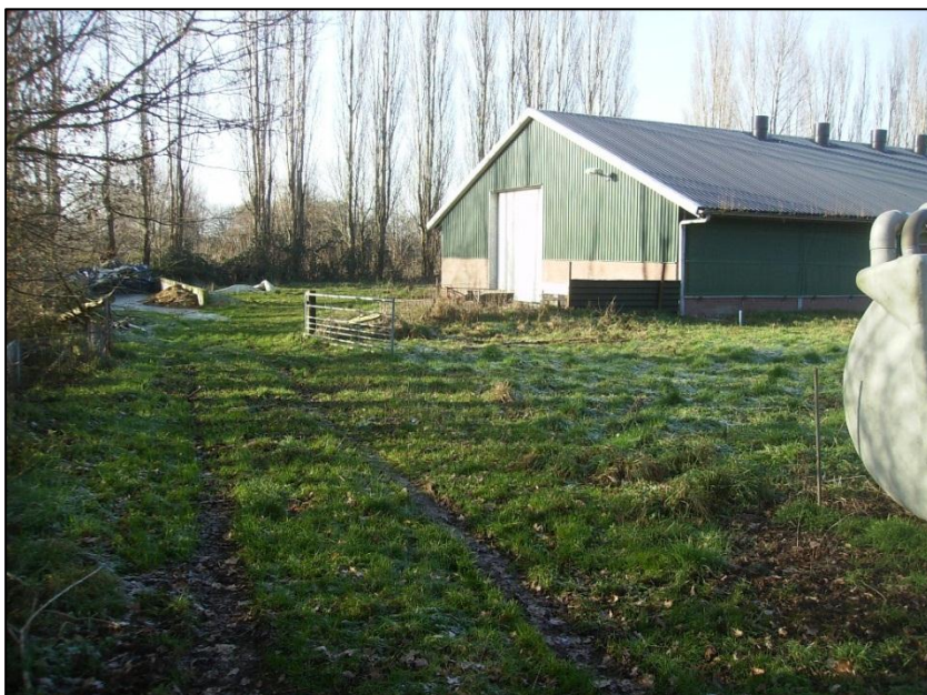
Afbeelding 6. Beeld van de achterkant van de bebouwing aan Fluunseweg 14

Op deze locatie zijn in totaal 27 boringen gezet. De boringen liggen deels op de huiskavel (zie afbeelding 6) en op de akker naast de huiskavel (zie afbeelding 7). Rond de bebouwing was het terrein verhard door middel van beton.