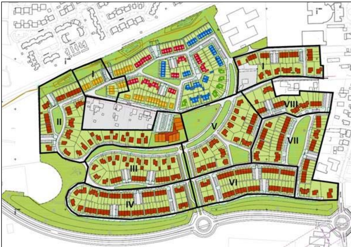
Figuur 1: Ligging van de woonwijk Kerkwijk

In de onderstaande figuur is de woonwijk Kerkwijk met de verschillende fasen weergegeven: