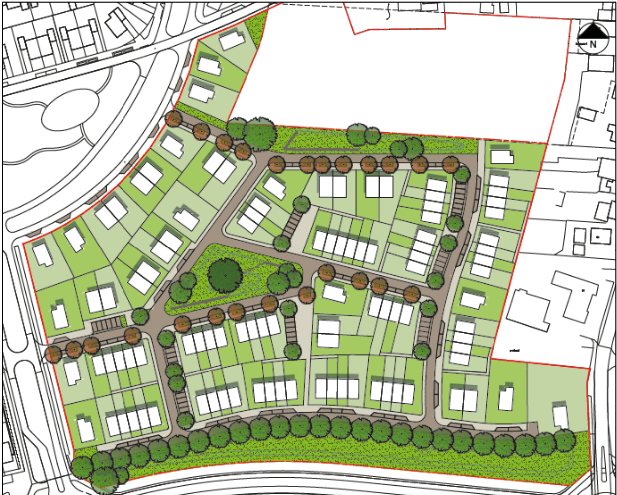
Figuur 2: Stedenbouwkundig ontwerp

In de onderstaande figuur is het stedenbouwkundige ontwerp 2 van plan weergegeven: