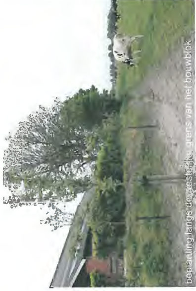
beploeting langs de westerzijde, grens van het bouwblok