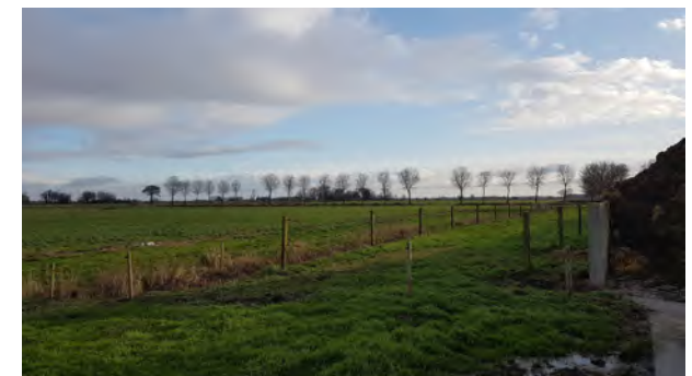
12. sloot vormt oostelijk begrenzing van het erf