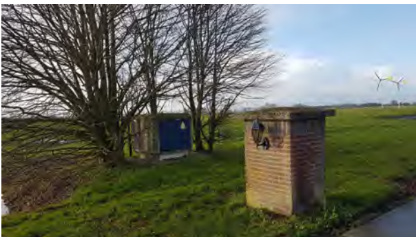
2. ingepast trafhuisje voor aan de weg