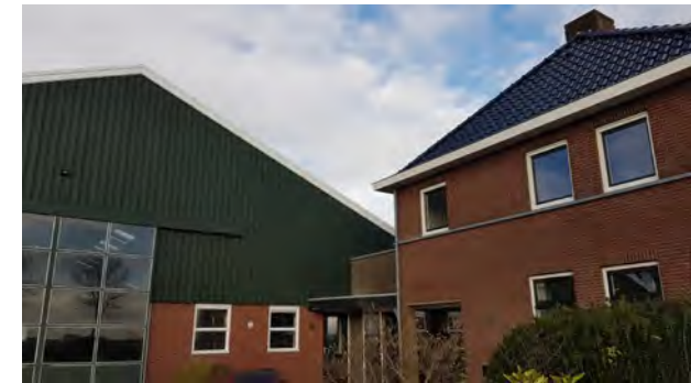
4. woning en verbinding met schuur