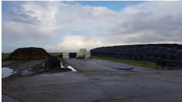
9. verhard achtererf met voeropslag