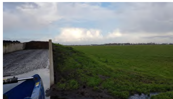
11. aangeaarde grasbegroeide sleufsilos