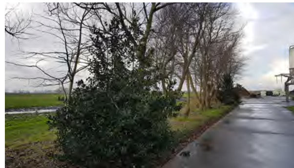
7. beplantingsbeeld westelijke erfrens