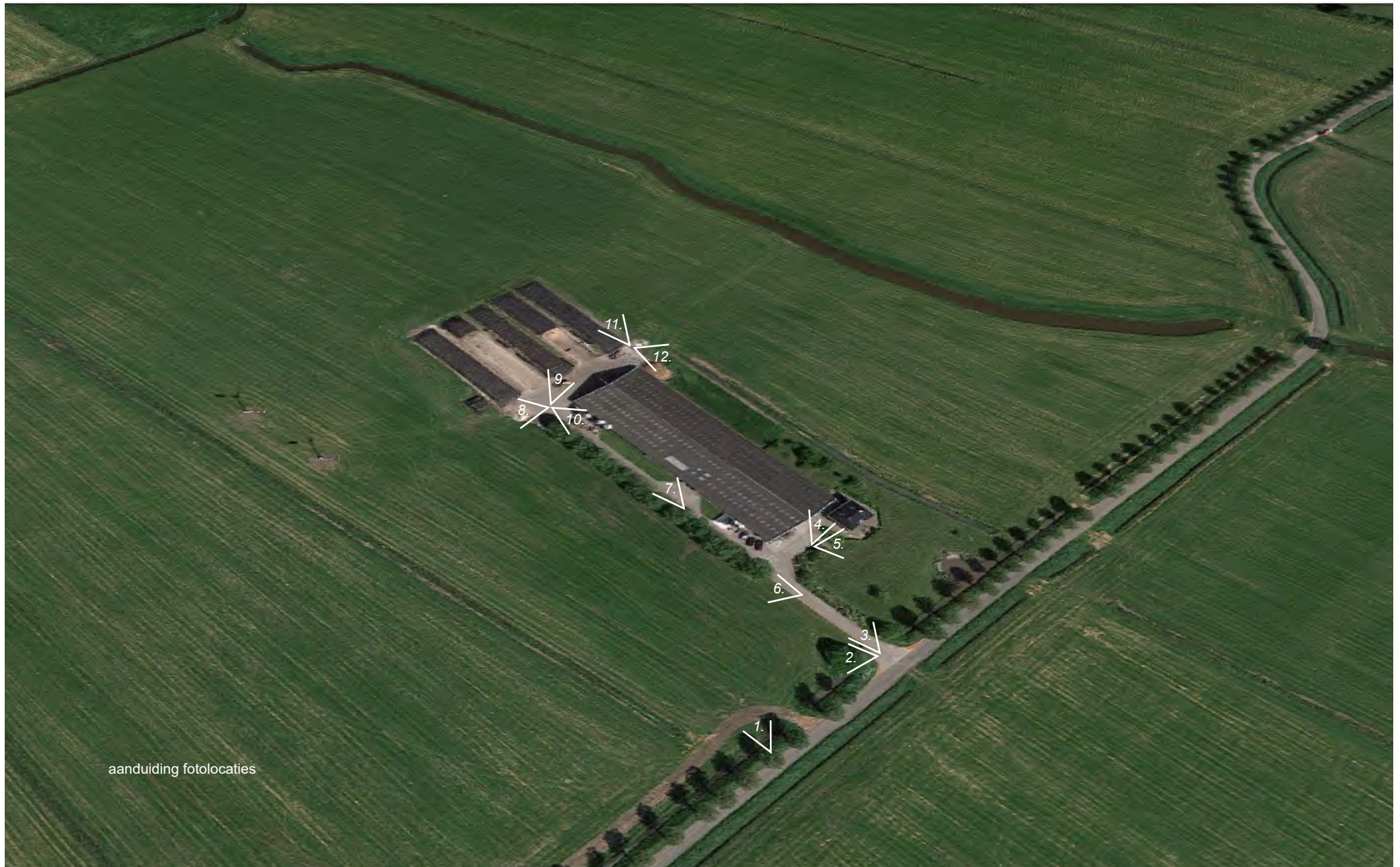
Foto analyse van de plek