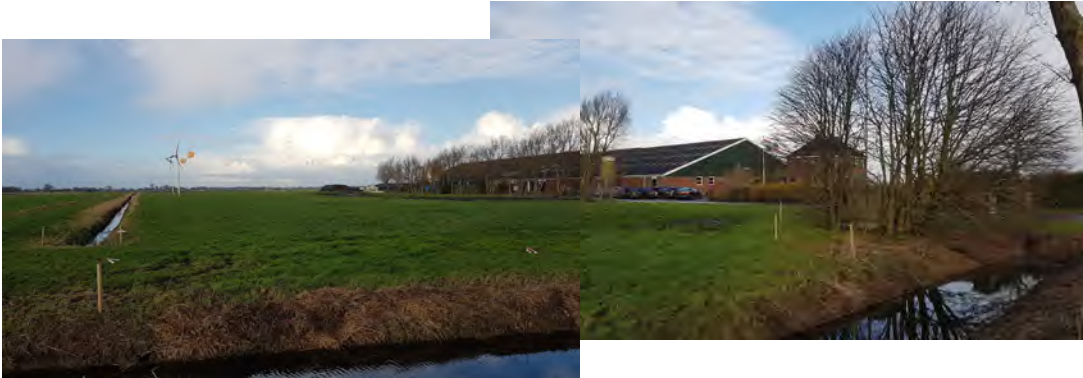
1. zicht op beplante westzijde van het erf vanaf de Luddeweesterweg