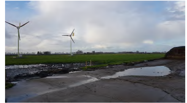
8. uitlooproute vee naar weide vanaf achterzijde erf