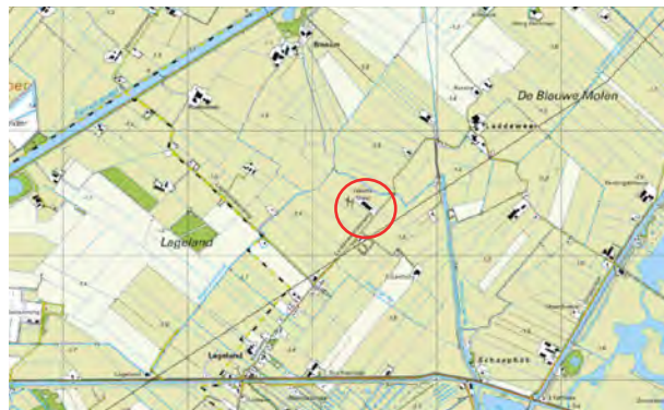
uitsnede topografische kaart met aanduiding ligging bedrijf

In dit advies wordt navolgend eerst bondig ingegaan op de context van het initiatief en de historische ontwikkeling van de plek en de directe omgeving. Daarna volgt een foto analyse van de kwaliteiten zoals we die nu aantreffen. Op basis hiervan is een erfontwikkelingsschets opgesteld waarin de positie van de beoogde gebouwen zijn vastgelegd en de noodzakelijke landschappelijke inpassingsmaatregelen schetsmatig zijn verbeeld. Tot slot is de schets tot op soortniveau uitgewerkt in een erfinrichtingsplan en voorzien van een kostenraming. De uitvoering hiervan is zal als voorwaarde aan de uiteindelijke vergunning worden gekoppeld.