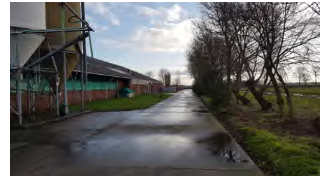
10. zicht over erftoegangspad richting de weg