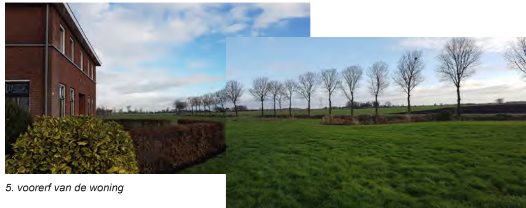
5. voorerf van de woning