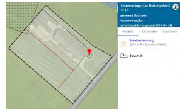
uitsnede bestemmingsplankaart buitengebied