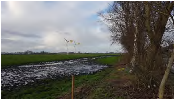
6. zicht langs beplante erfrens op bestaande kleinschalige windturbines