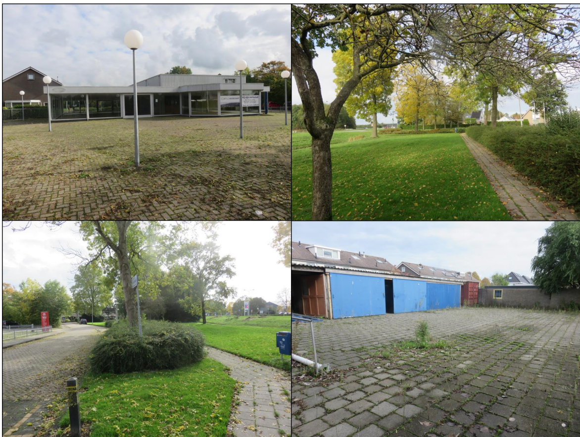
Figuur 1.2. Impressie van het plangebied.

Het planvoornemen bestaat uit het slopen van het bestaande gebouw van de garage/autodealer en de daarbij horende werkplaats, parkeergelegenheden en berging om plaats te maken voor een appartementencomplex met parkeergelegenheden en bergingen. De huidige Linthorst Homanstraat wordt circa 20 meter in oostelijke richting verlegd om plaats te maken voor dit appartementencomplex. Het is onduidelijk of de bomen aan de westzijde van de huidige Linthorst Homanstraat worden gekapt.