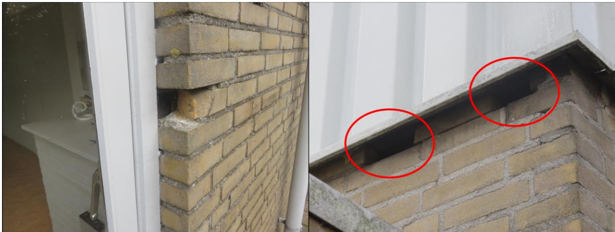
Figuur 2.3. Een afgebroken baksteen en stootvoegen rond het gebouw van de garage/autodealer.

Echter, rond het gebouw van de garage/autodealer zijn enkele ruimten aangetroffen in de vorm van stootvoegen en afgebroken bakstenen waarbij in één geval de spouw zichtbaar en toegankelijk was (figuur 2.3). Deze ruimten kunnen functioneren als doorgangen tot verblijfplaatsen van vleermuizen als de gewone dwergvleermuis. De aanwezigheid van verblijfplaatsen van vleermuizen binnen het plangebied kan dan ook niet op voorhand worden uitgesloten.