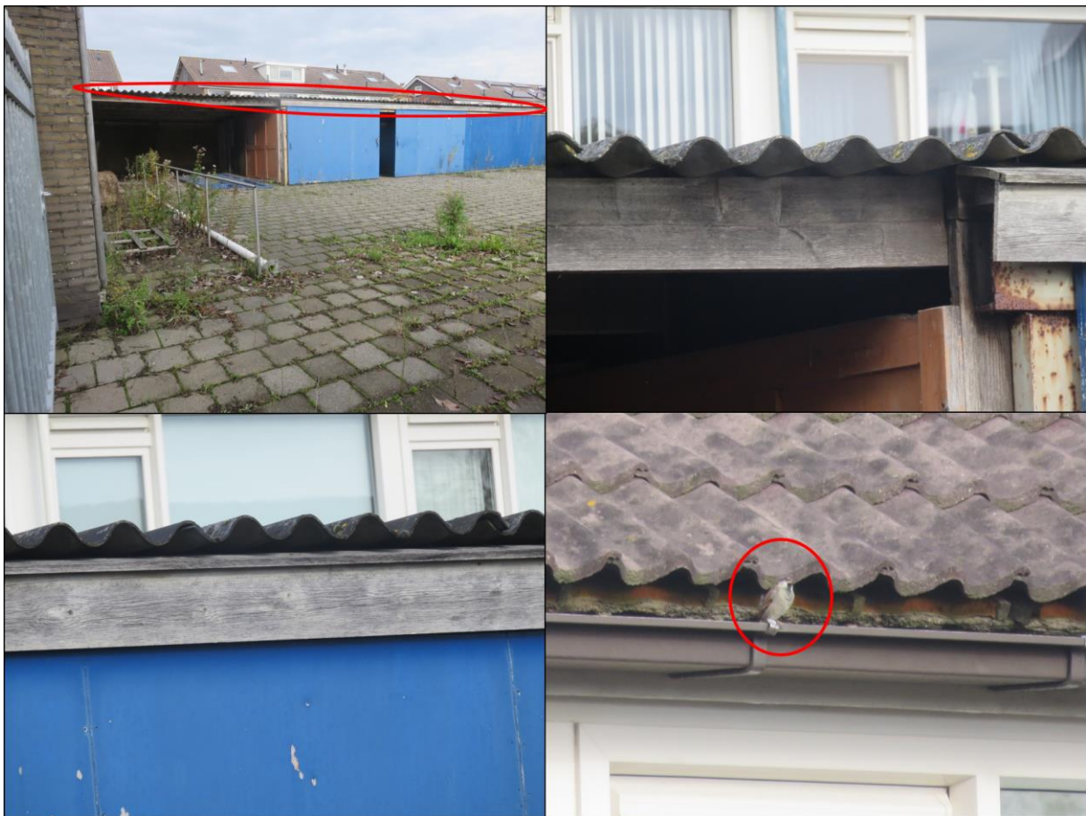
Figuur 2.2. Nestgelegenheden voor de huismus in de vorm van gegolfde dakplaten en een territoriale huismus vlak buiten het plangebied.

Het plangebied is tevens gecontroleerd op jaarrond beschermde nesten van vogels die over het algemeen in bebouwing tot broeden komen, zoals de kerkuil, huismus en gierzwaluw. Door de afwezigheid van geschikte invliegopeningen kan de aanwezigheid van de kerkuil binnen het plangebied op voorhand worden uitgesloten. Hiernaast kan ook de aanwezigheid van de gierzwaluw op voorhand worden uitgesloten. De gierzwaluw staat bekend als soort die gebruik maakt van hoog gelegen nestgelegenheden. Het gebouw van de garage/autodealer voldoet niet aan deze hoogte eis. Dit is echter niet het geval voor de huismus. Het overdekte gedeelte van de berging achter de garage/autodealer beschikt over gegolfde dakplaten. Onder deze gegolfde dakplaten zijn ruimten aangetroffen welke mogelijk verblijfplaatsen van de huismus kunnen vormen. Hiernaast zijn er ten tijde van het veldbezoek territoriale huismussen aangetroffen in de directe omgeving van het plangebied (figuur 2.2.). De aanwezigheid van verblijfplaatsen van de huismus binnen het plangebied kan niet op voorhand worden uitgesloten.