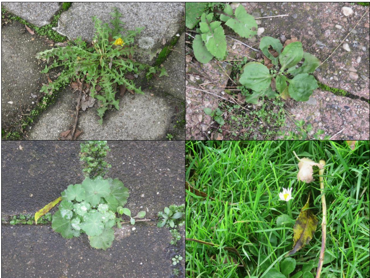
Figuur 2.1. Impressie van de flora in het plangebied met v.l.b.n.r.o.: paardenbloem, brede weegbree, fraaie vrouwenmantel en madeliefje.