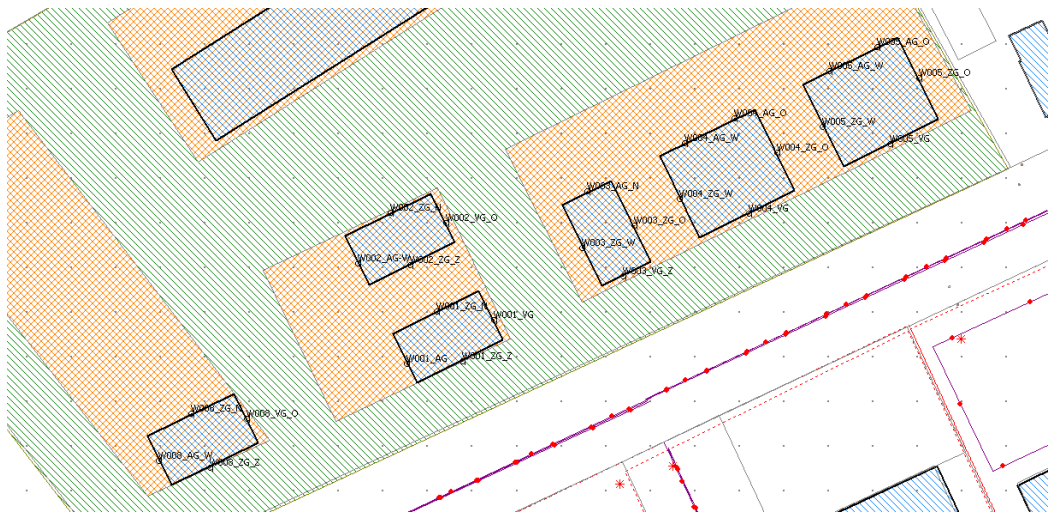
Fig_INV001 Locatie individuele woningen en bijbehorende toetspunten