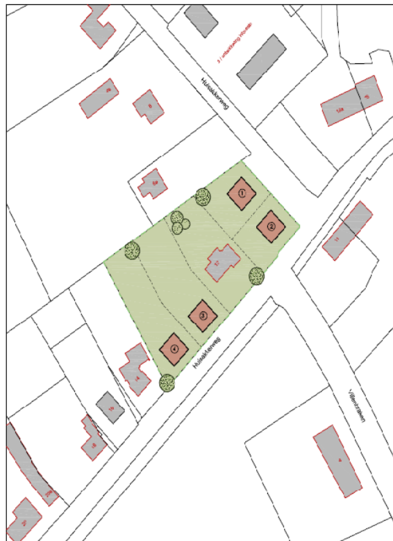
Situatie 0m 20m