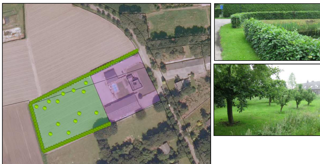
Figuur 1: Inpassing van de bedrijfslocatie aan Vresselseweg 58

De bedrijfswoning aan Vresselseweg 58 is reeds landschappelijk inpast aan de voorzijde. In samenhang met herbestemming van de bedrijfslocatie aan Vresselseweg 58 worden daarnaast in het kader van de landschapsinvesteringsregeling tevens nieuwe landschapselementen toegevoegd. Navolgende figuur geeft een beeld van de beoogde landschappelijke inpassing voor de locatie Vresselseweg 58.