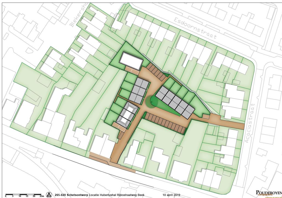
Figuur 3.1. De voorgestane situatie.

De tennis- en squashhal worden gesloopt en de verharding wordt verwijderd. De woning in het noordwesten van het plangebied (3 in figuur 4.1) blijft behouden. In het plangebied worden 11 woningen met achtertuinen en parkeerplaatsen gerealiseerd. De voorgenumen situatie is weergegeven in figuur 3.1.