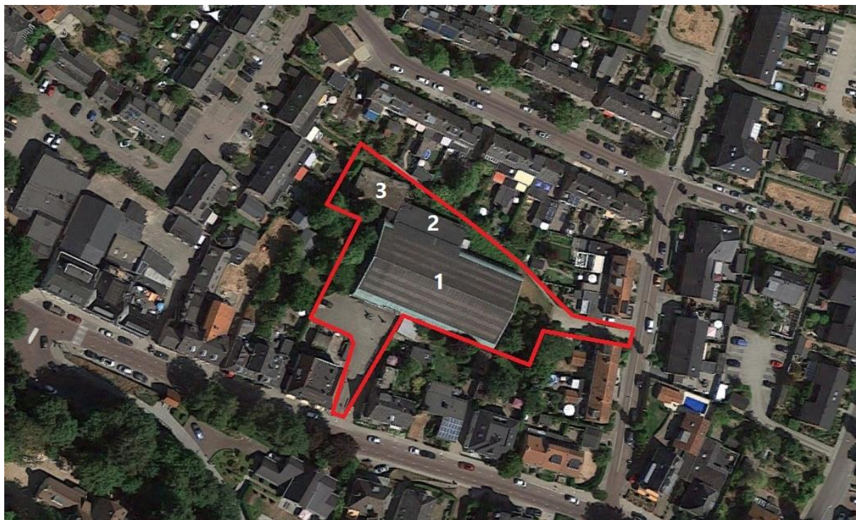
Figuur 4.1. Het plangebied met de tennishal (1), squashhal (2) en de te behouden woning (3).

Het plangebied zelf is ingericht als tennishal. Ten noorden van de tennishal ligt een squashhal. Ten noordwesten van de squashhal ligt de te behouden woning (zie figuur 4.1). Omdat de woning niet wordt gesloopt, valt deze feitelijk buiten het plangebied. Daarnaast is er een parkeerplaats en zijn er twee inritten aanwezig. Rondom de woning en aan de noord- en oostzijde van de tennishal is een tuin aanwezig met een gazon en soorten als bosaardbei, paardenbloem, braam, gewone reigersbek, stinkende gouwe, laurierkers, look-zonder-look, spar, paarse dovenetel, haagwinde, Japanse duizendknoop, bastaardwederik, pinksterbloem, madelief, vergeet-me-niet, zachte ooievaarsbek, gewone melkdistel, kruipende boterbloem, zevenblad en paardenbloem.