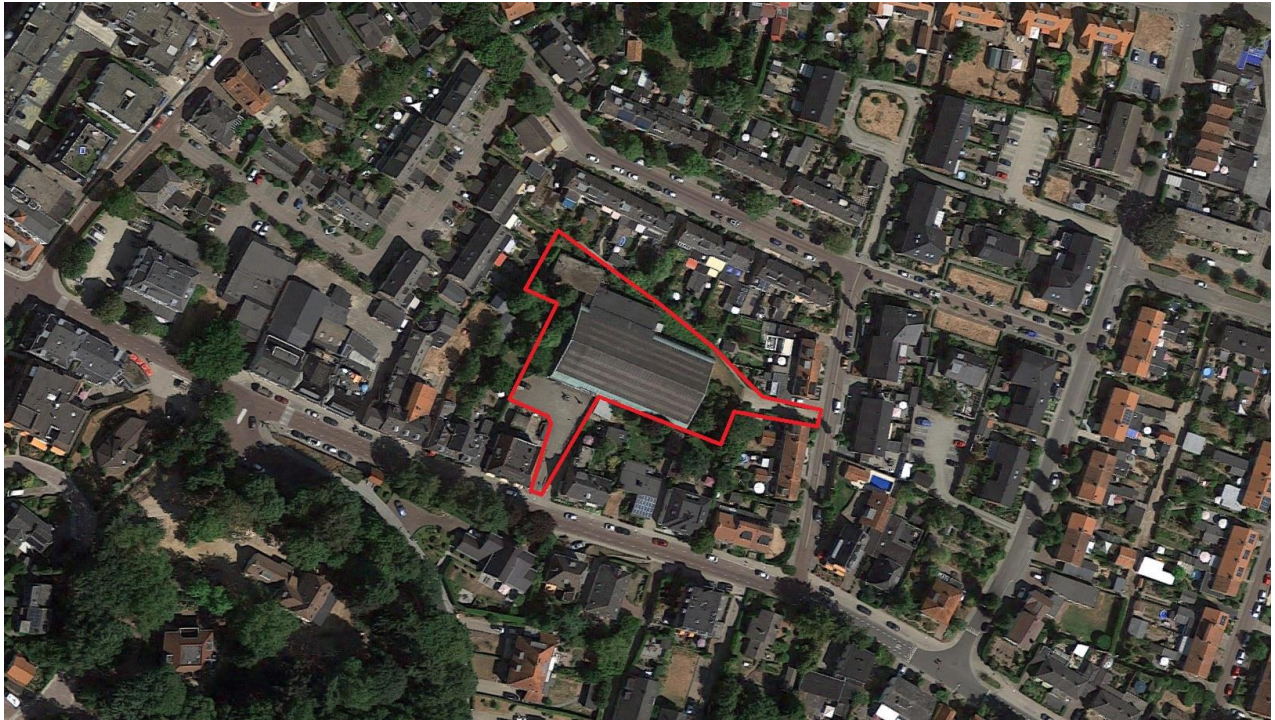
Figuur 1.1. Ligging van het plangebied (rood omlijnd).

Zwartbol Planontwikkeling & Advies B.V. begeleidt de ontwikkeling van nieuwbouwwoningen te Beek (gemeente Berg en Dal, provincie Gelderland) en heeft Faunaconsult opdracht gegeven de effecten op beschermde natuurwaarden te bepalen middels een quickscan natuurwetgeving. Figuur 1.1 geeft de ligging weer van de locatie waar deze ontwikkeling zal worden gerealiseerd (het plangebied).