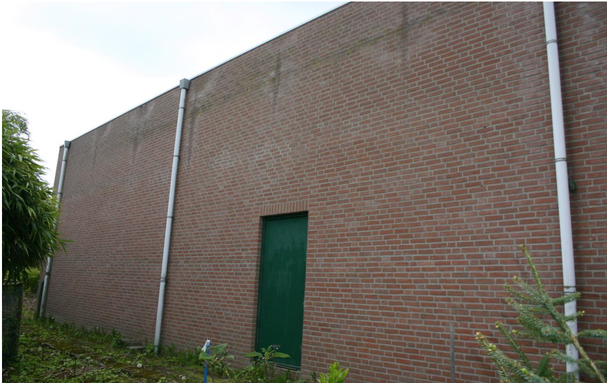
Figuur 4.5. De squashhal in het noorden van het plangebied.

Sporen, wissels, uitwerpselen etc. van zoogdieren, die behoren tot de categorieën ‘Internationaal beschermde soorten’ zijn tijdens het veldbezoek niet aangetroffen. De met vegetatie begroeide delen van het plangebied dienen mogelijk wel als landhabitat van enkele algemene zoogdiersoorten. Overige algemene zoogdieren zoals de veldmuis kunnen mogelijk in het plangebied voorkomen. Tabel 4.5 geeft de zoogdiersoorten weer die (mogelijk) een vaste rust- en verblijfplaats in het plangebied hebben.