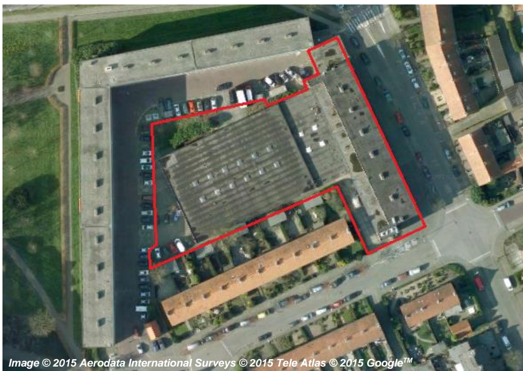
Afbeelding 1: Luchtfoto bestaande situatie plangebied (plangebied in rood kader, boven: globale ligging in groter verband, onder: gedetailleerde ligging in nabije omgeving)