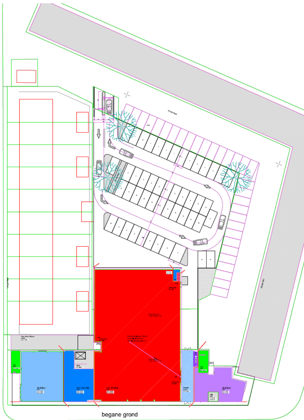
Afbeelding 2: Toekomstige situatie plangebied