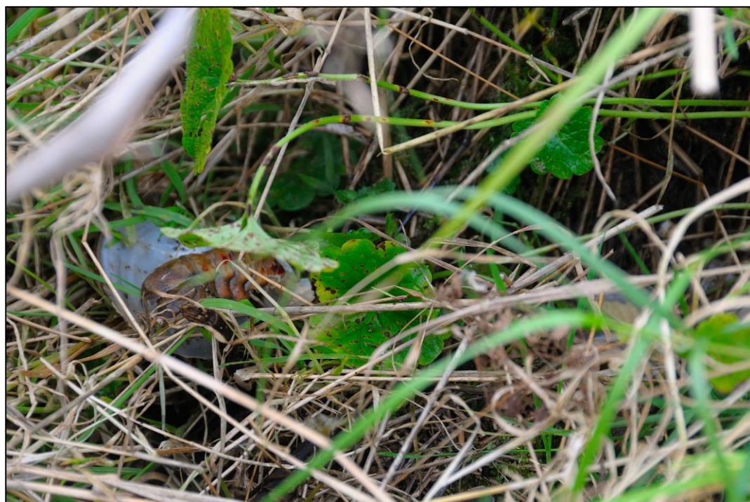
Afbeelding 2. Rode Amerikaanse rivierkreeft.