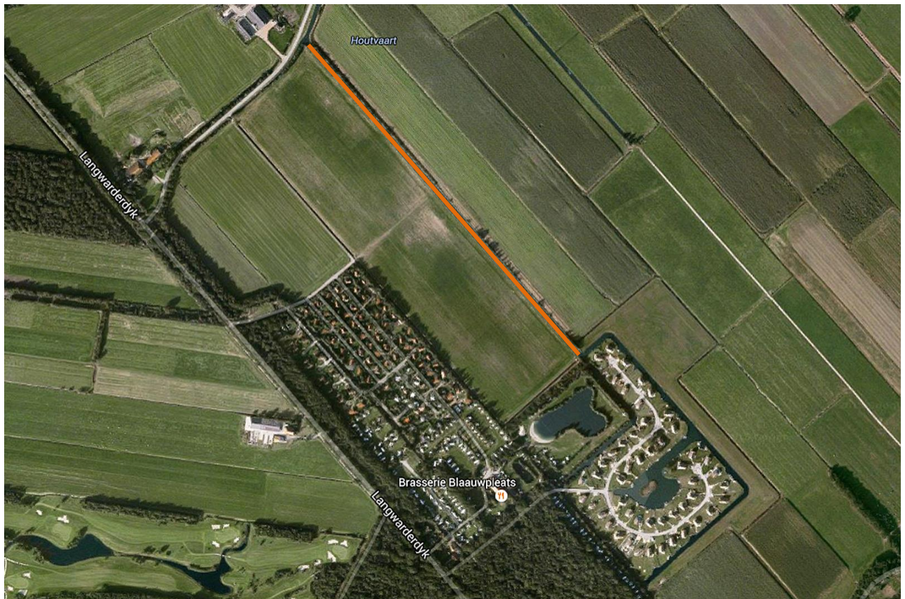
Figuur 1. Onderzoekgebied (oranje lijn) Houtvaart Sint Nicolaasga.

Het veldonderzoek is uitgevoerd op 28 oktober 2015. Zie figuur 1. voor het onderzoeksgebied.