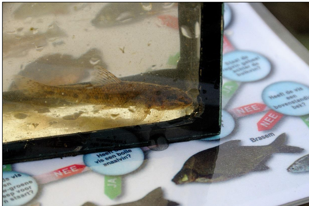
Afbeelding 1. Riviergrondel.

Tijdens het onderzoek zijn de volgende niet-beschermde soorten aangetroffen: de riviergrondel ( Gobio gobio - afbeelding 1.) en de rode Amerikaanse rivierkreeft ( Procambarus clarkii - afbeelding 2.).