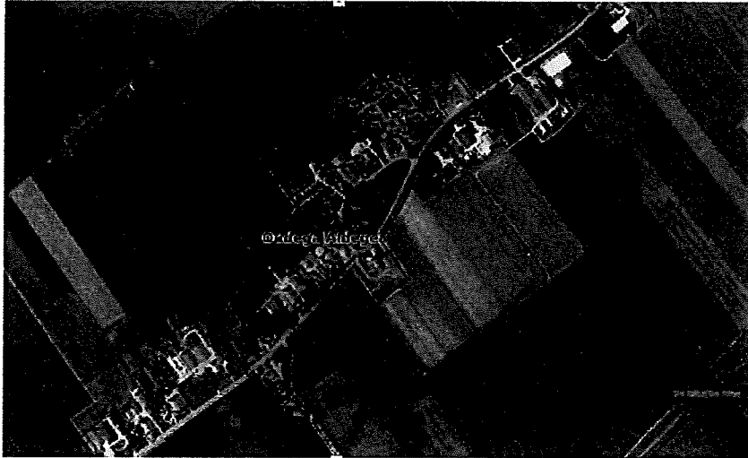
Figuur 1: begrenzing plangebied

Risicobronnen ten aanzien van het concept bestemmingsplan “Oudega 2016” De gemeente De Fryske Marren is bezig om het vigerende bestemmingsplan te actualiseren. Het bestemmingsplan heeft een overwegend conserverend karakter. Het plangebied (zie figuur 1) is gelegen tussen Koudum en Balk.