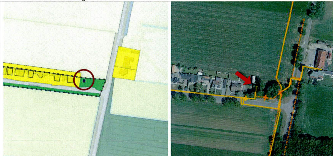
Afbeelding 1a: Uitsnede van het voorontwerp met locatie van het gasdrukmeet- en regelstation (rode cirkel).