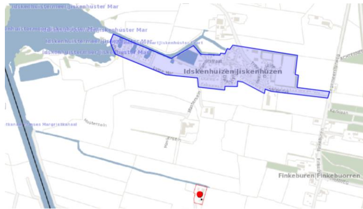
Figuur 2: risicobronnen

Geconcludeerd kan worden dat het aspect externe veiligheid geen belemmering vormt voor de haalbaarheid van voorliggend plan.