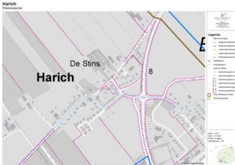
Figuur 1 Waterspecten Wetterskip Fryslân