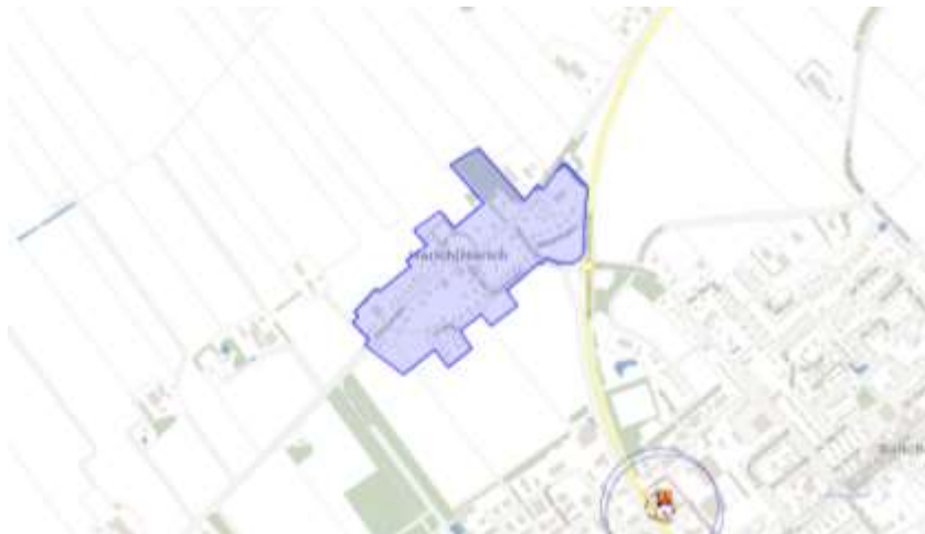
Figuur 2: begrenzing plangebied met risicobronnen

Uit de professionele Risicokaart blijkt dat in de directe nabijheid van het plan een risicobron is gelegen waarvan de risicocontour of het invloedsgebied zich binnen het plan bevindt (zie figuur 2).