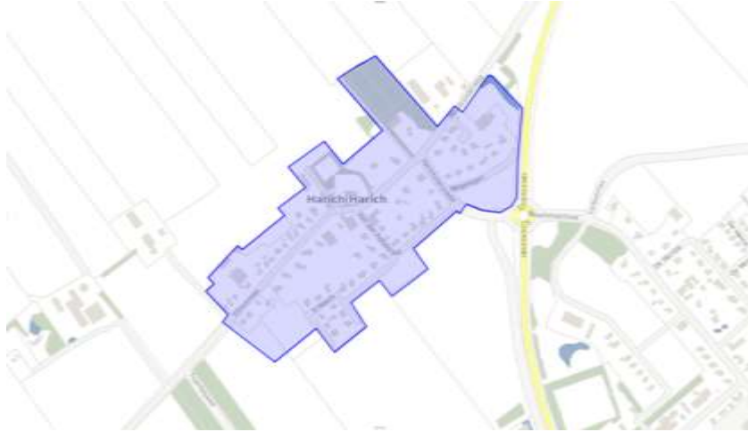
Figuur 1: begrenzing plangebied

Het plangebied "Harich" is gelegen ten noordwesten van Balk. De ligging van het plangebied is in figuur 1 weergegeven.