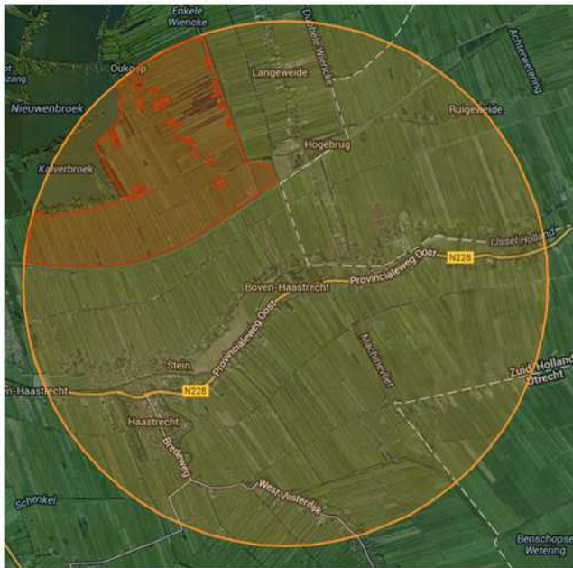
Ligging van Natura 2000-gebied in een straal van 3 kilometer rondom het plangebied.

Het plangebied ligt niet in- of in de direct naast een Natura 2000-gebied of Beschermd Natuurmonument. Op circa een kilometer ten noorden ervan ligt het Natura 2000-gebied 'Broekvelden, Vettenbroek & Polder Stein' (Min. EZ 2014).