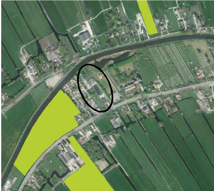
Ligging van gronden welke tot de EHS behoren nabij het onderzoeksgebied (ovaal).

Het plangebied ligt niet in EHS en grenst er ook niet aan (bron: provincie Zuid-Holland, 2014). Op onderstaande kaart wordt de ligging van de EHS weergegeven.