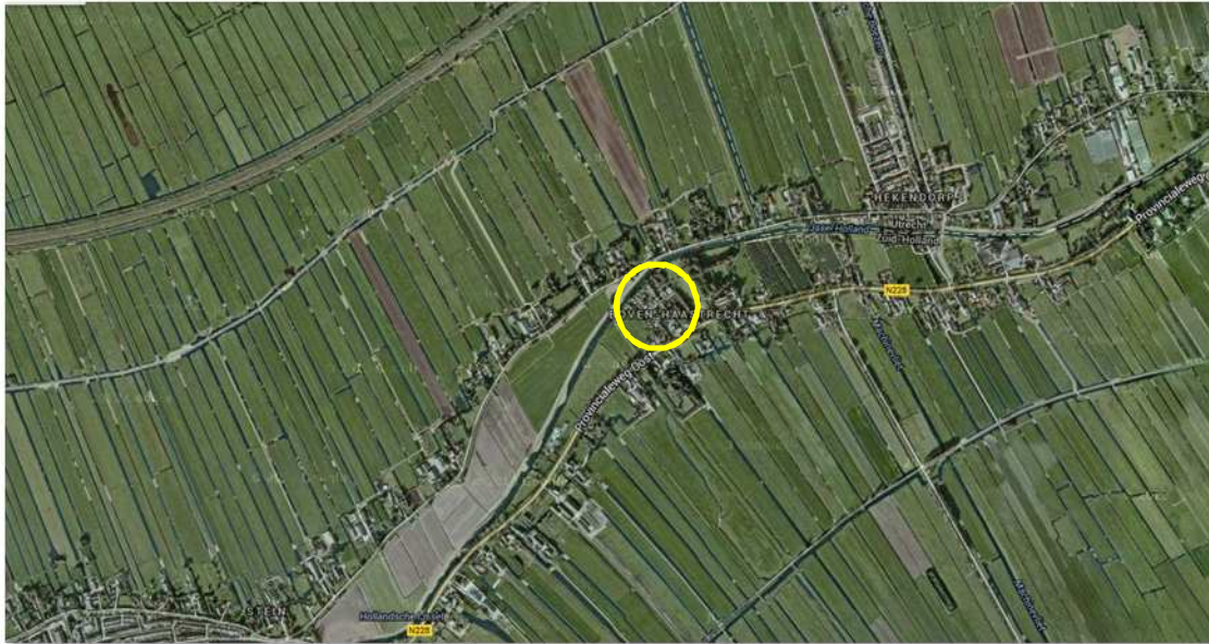
Globale ligging van het plangebied in de omgeving. Het gebied wordt met de gele cirkel aangeduid.

Het onderzoeksgebied ligt aan de Provincialeweg Oost 64 in Boven Haastrecht. Het is gelegen tussen de Hollandse IJssel aan de noordzijde en de Provincialeweg oost aan de zuidzijde in. Het maakt onderdeel uit van lintbebouwing zoals dat aanwezig is langs de Provincialeweg Oost. Het plangebied grenst aan de noordzijde aan open water, aan de oostzijde aan grasland, aan de zuidzijde aan een burgerwoning met siertuin en aan de westzijde aan een verruigd terrein waarop tot voor kort een camping aanwezig was. Op onderstaande kaart wordt de globale ligging van het plangebied in de omgeving weergegeven.