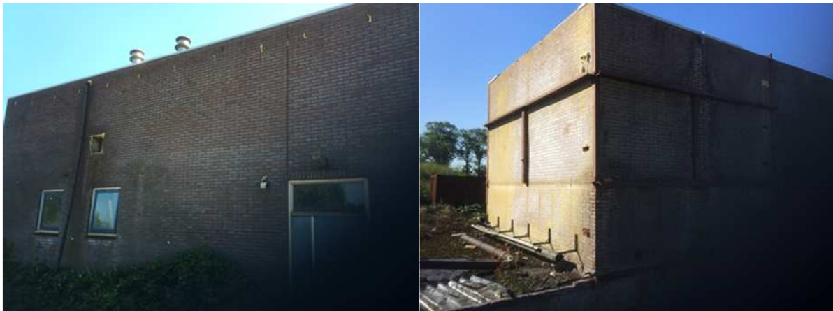
Potentiële invliegopeningen voor vleermuizen om de spouwmuur te bereiken zijn dichtgemaakt met purschuim.

Er zijn geen vleermuizen waargenomen in het onderzoeksgebied en er zijn geen sporen gevonden op de aanwezigheid van een verblijfplaats duiden. In 2014 zijn potentiële invliegopeningen in gebouwen dichtgespoten met purschuim waardoor de holle spouw niet toegankelijk is voor vleermuizen. De aanwezigheid van een solitaire zomerverblijfplaats van een algemene soort als gewone dwergvleermuis kan op basis van de uitgevoerde visuele inspectie niet volledig uitgesloten worden, maar de bebouwing wordt niet geschikt bevonden als kraamkolonie of als verblijfplaats voor groepen vleermuizen in de zomer- en winter.