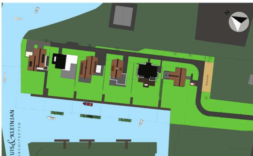
Weergave van de wenselijke nieuwe situatie.

De voorgenomen activiteit bestaat uit het volledig herontwikkelen van het plangebied. Daartoe wordt alle bestaande bebouwing gesloopt en wordt het perceel bouwrijp gemaakt voor de bouw van zes vrijstaande woningen. Aan de westzijde van de woningen wordt een haven gegraven zodat de haven in verbinding staat met de Hollandse IJssel.