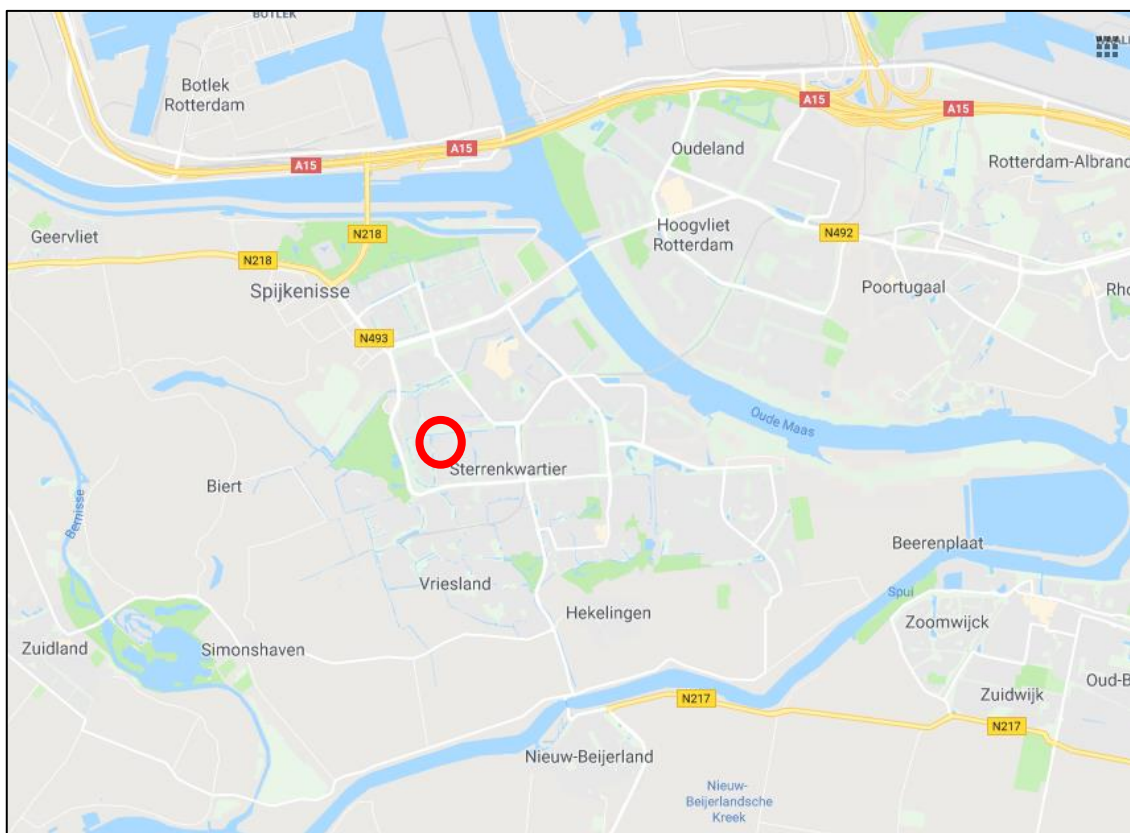
Figuur 1: Plangebied Sterrenkwartier (rood omcirkeld) te Spijkenisse

Het plangebied maakt geen deel uit van het Natuurnetwerk Nederland (NNN) of van een belangrijk weidevogelgebied. Omdat er, als gevolg van de voorgenomen plannen, geen oppervlakte aan NNN of weidevogelgebied verloren gaat, is er geen toetsing aan de wet- en regelgeving omtrent deze wet- en regelgeving nodig.