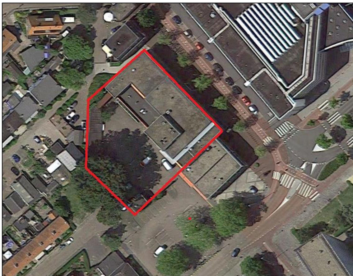
Figuur 2: Plangebied (rood omlijnd) Marrewijklaan 18-20 te Spijkenisse.