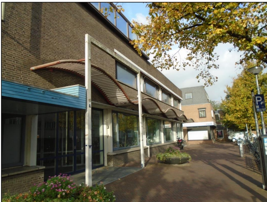
Foto 1: Plangebied

Het plangebied bevindt zich in het centrum van Spijkenisse aan de Marrewijklaan en wordt in het zuidoosten begrensd door een park. Alle andere zijdes worden begrensd door bebouwing.