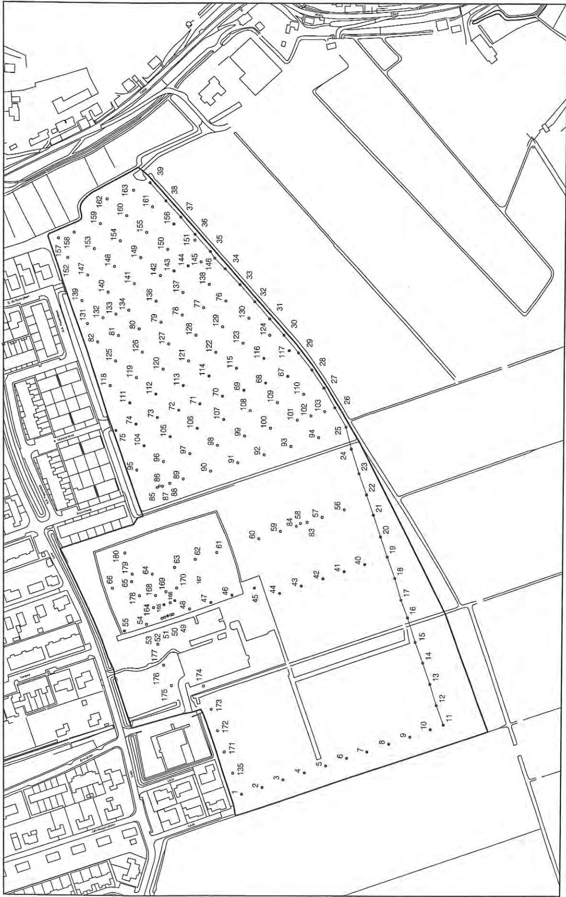
Afb. 1. Het onderzoeksgebied met ligging van de boringen en van het profiel.

• boring tot in Hollandveen • boring tot in Afzettingen van Calais