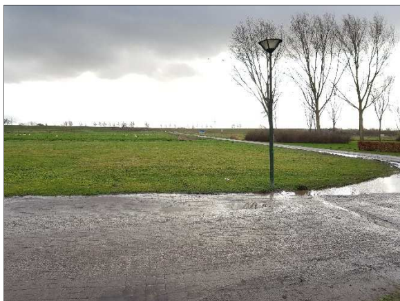
Figuur 8. Zuidelijke percelen gezien vanaf Huibrecht Hordijklaan