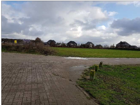
Figuur 4. Grasveld en achterliggende woningen gezien vanaf Huibrecht Hordijklaan