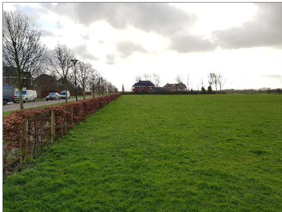
Figuur 6. Grasveld, haag en woningen gezien vanaf Lede