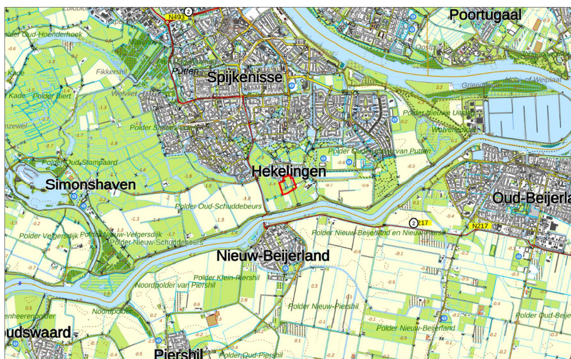
Figuur 1. Topografische kaart ligging van het plangebied (1:25.000)

Het plangebied van Heer & Meester West grenst met de noordzijde aan Hekelingen dorp, aan de oostzijde aan Park Waterrijk en aan de west- en zuidzijde aan het buitengebied. In figuur 1 is de topografische ligging van het plangebied weergegeven.