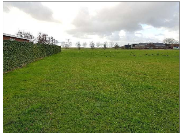
Figuur 7. Grasveld en woningen gezien vanaf Kaatje Mollaan