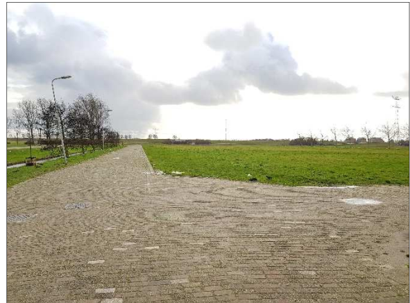
Figuur 5. Grasveld gezien vanaf Dirk Oosthoeklaan