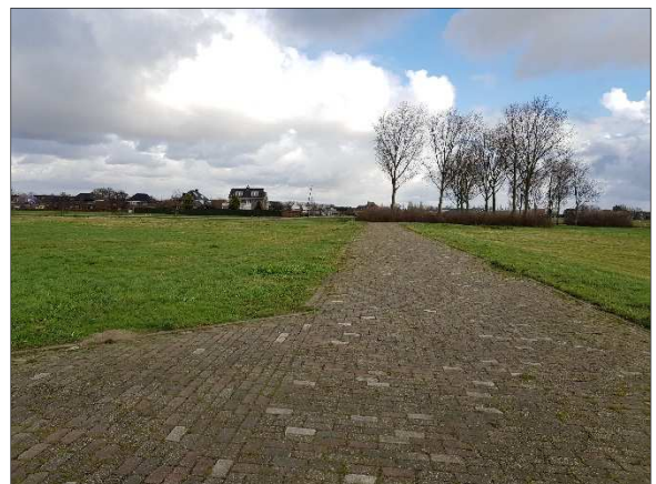
Figuur 9. Zuidelijke percelen gezien vanaf Dirk Oosthoeklaan