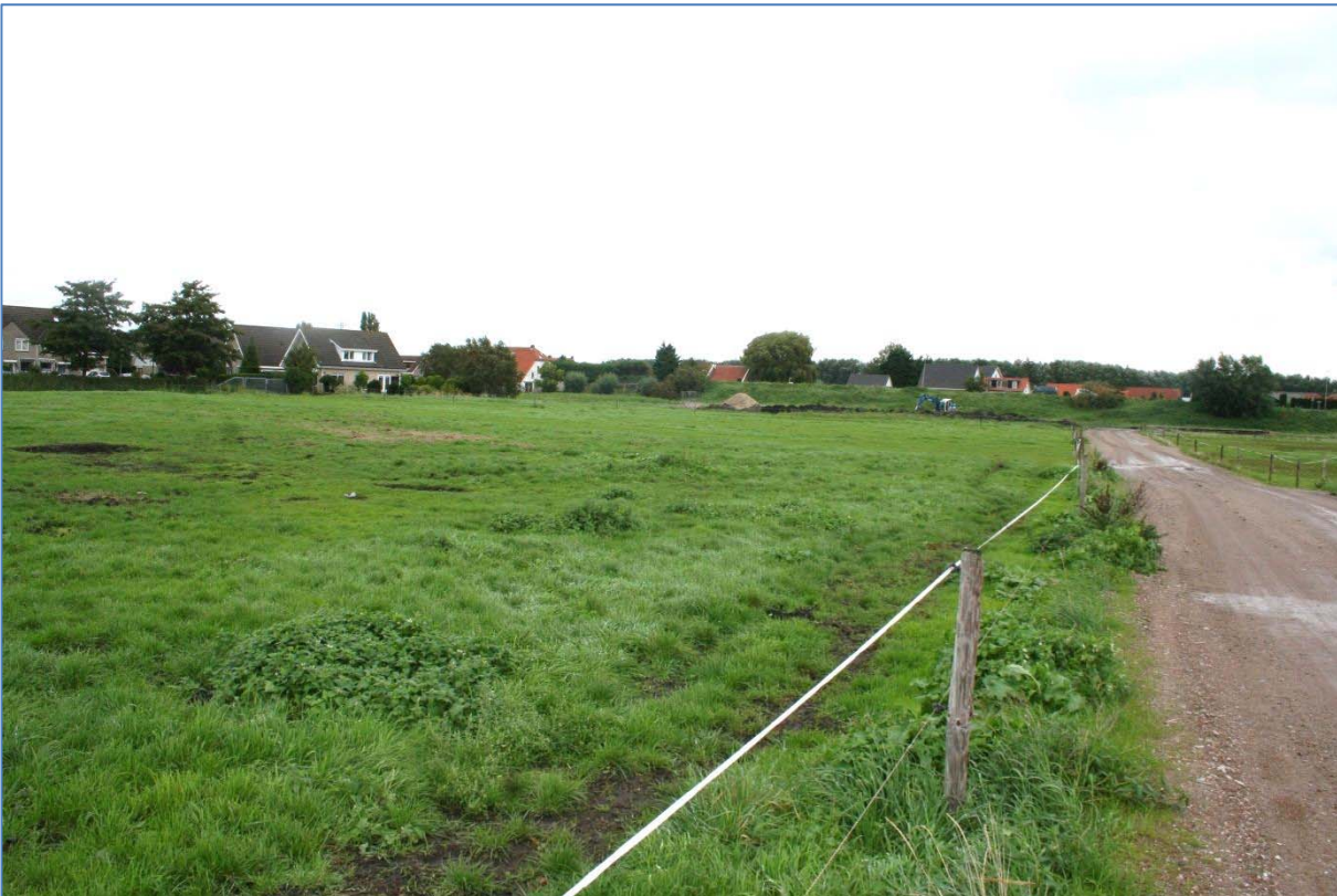
Plangebied Hekelingen, fase 2 met op de achtergrond de Toldijk.

Het plangebied is op 16 september 2015 bezocht om enerzijds de aanwezige en aangrenzende biotopen te beschrijven en anderzijds eventuele incidentele waarnemingen te doen van beschermde flora en fauna (voor zover waarneembaar). Op basis van de aangetroffen biotopen en informatie uit de vakliteratuur over populaties in de omgeving, is per soortgroep een inschatting gemaakt van het mogelijk voorkomen van in ieder geval die beschermde soorten waarvoor, indien aanwezig, ontheffing moet worden aangevraagd bij werkzaamheden in het kader van ruimtelijke inrichting en ontwikkeling.