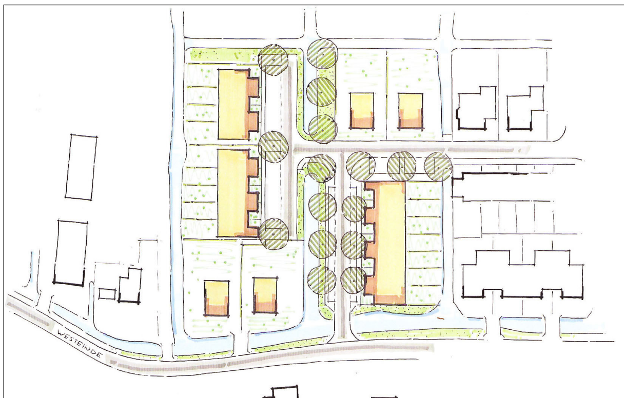
Variant inrichtingsplan Wijngaarden-West