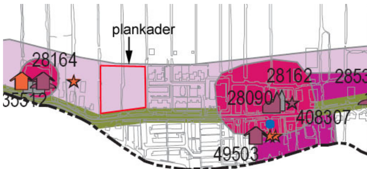
Uitsnede uit de concept-archeologische verwachtingskaart Graafstroom