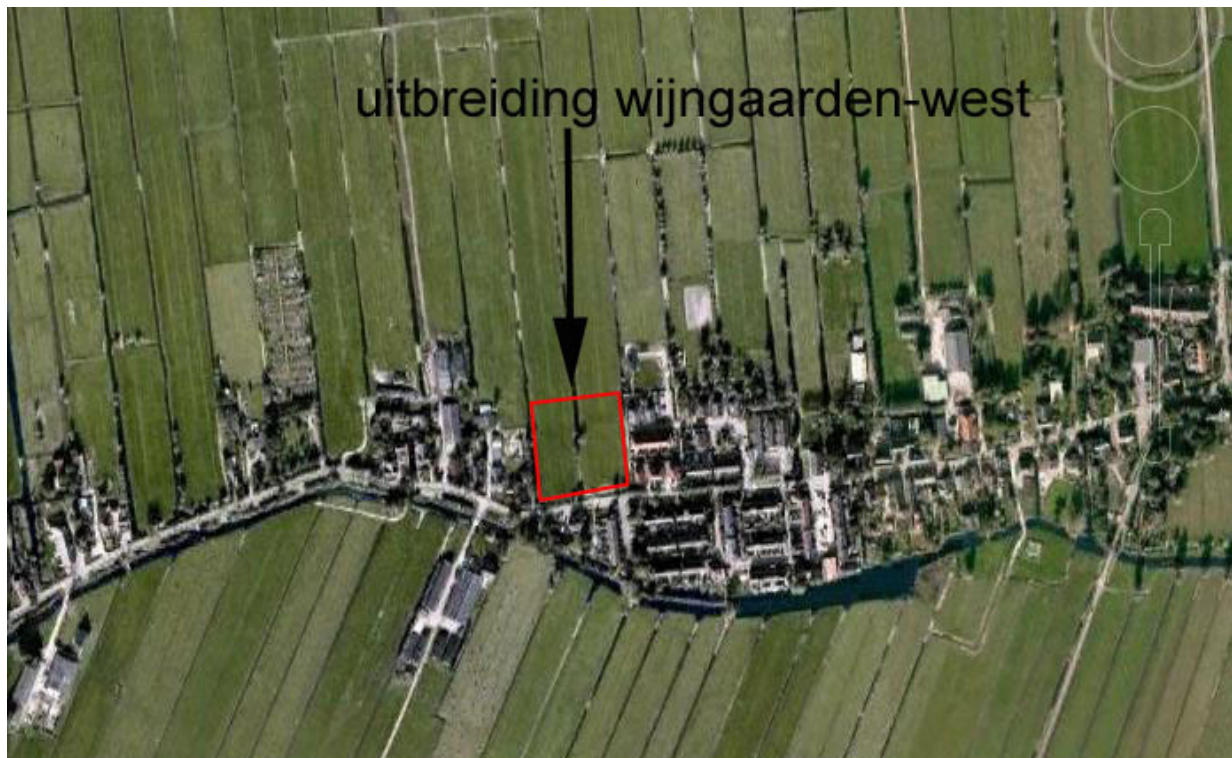
Ligging van het plankader Wijngaarden-West