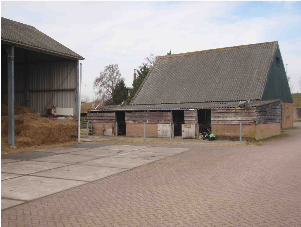
Foto 1 Overzicht plangebied met beide schuren.

De ingreep bestaat uit het realiseren van verscheidene woningen waaronder een dijkwoning. Hierbij worden de aanwezige opstallen (kapschuur en stal) verwijderd en de aangrenzende sloot gedeeltelijk verbreed.