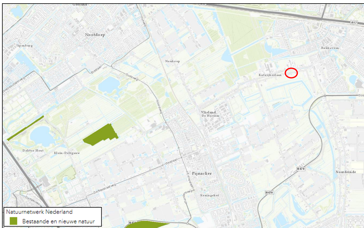
Figuur 4: kaart NNN. Het plangebied en omgeving is rood omcirkeld

In de navolgende figuur 4, overgenomen uit de kaart van het Natuurbeheerplan van de provincie Zuid-Holland is wederom het aandachtsgebied omcirkeld. Ook uit deze figuur blijkt dat het plangebied niet in een beschermd gebied ligt. Het dichtstbijzijnde natuurgebied behorende tot het NNN is op een afstand van circa 4,3 kilometer ten zuidwesten van het plangebied gelegen.