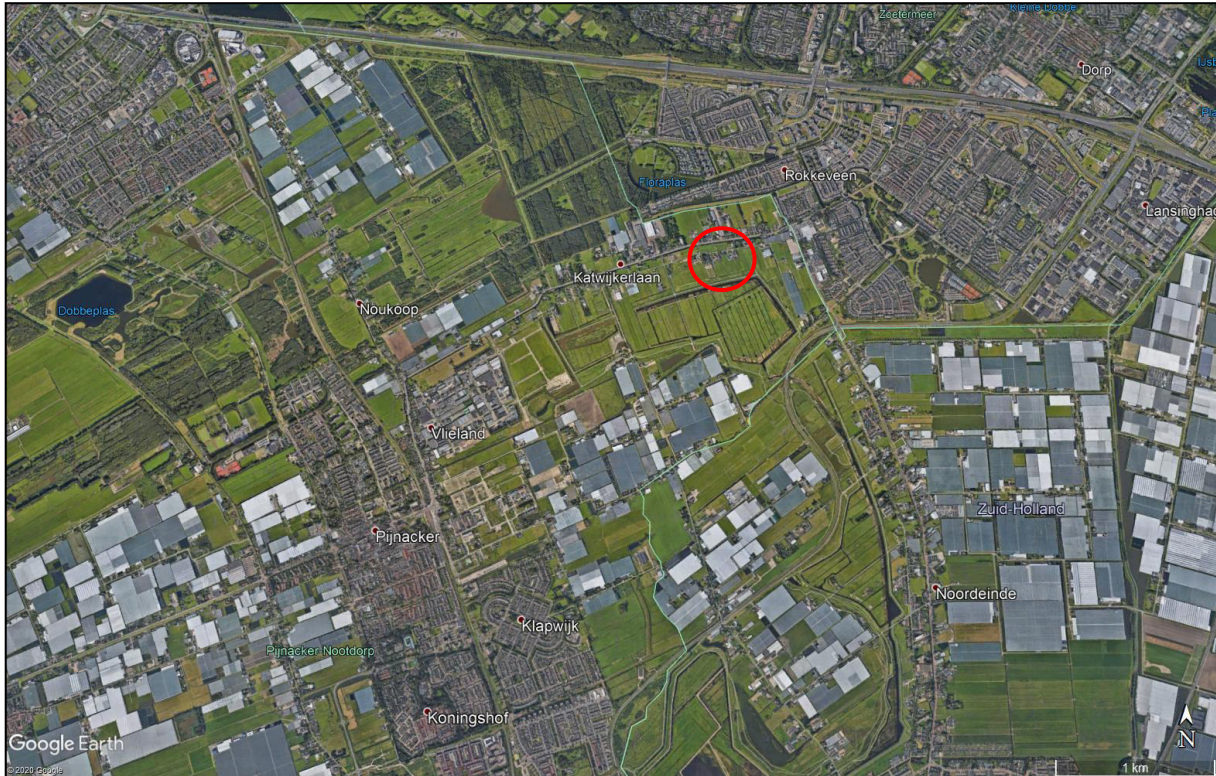
Figuur 2: luchtfoto van de omgeving van het plangebied (rood omcirkeld)

Uit onderstaande luchtfoto (figuur 2) kan worden opgemaakt dat het plangebied buiten de bebouwde kom van Pijnacker is gelegen.