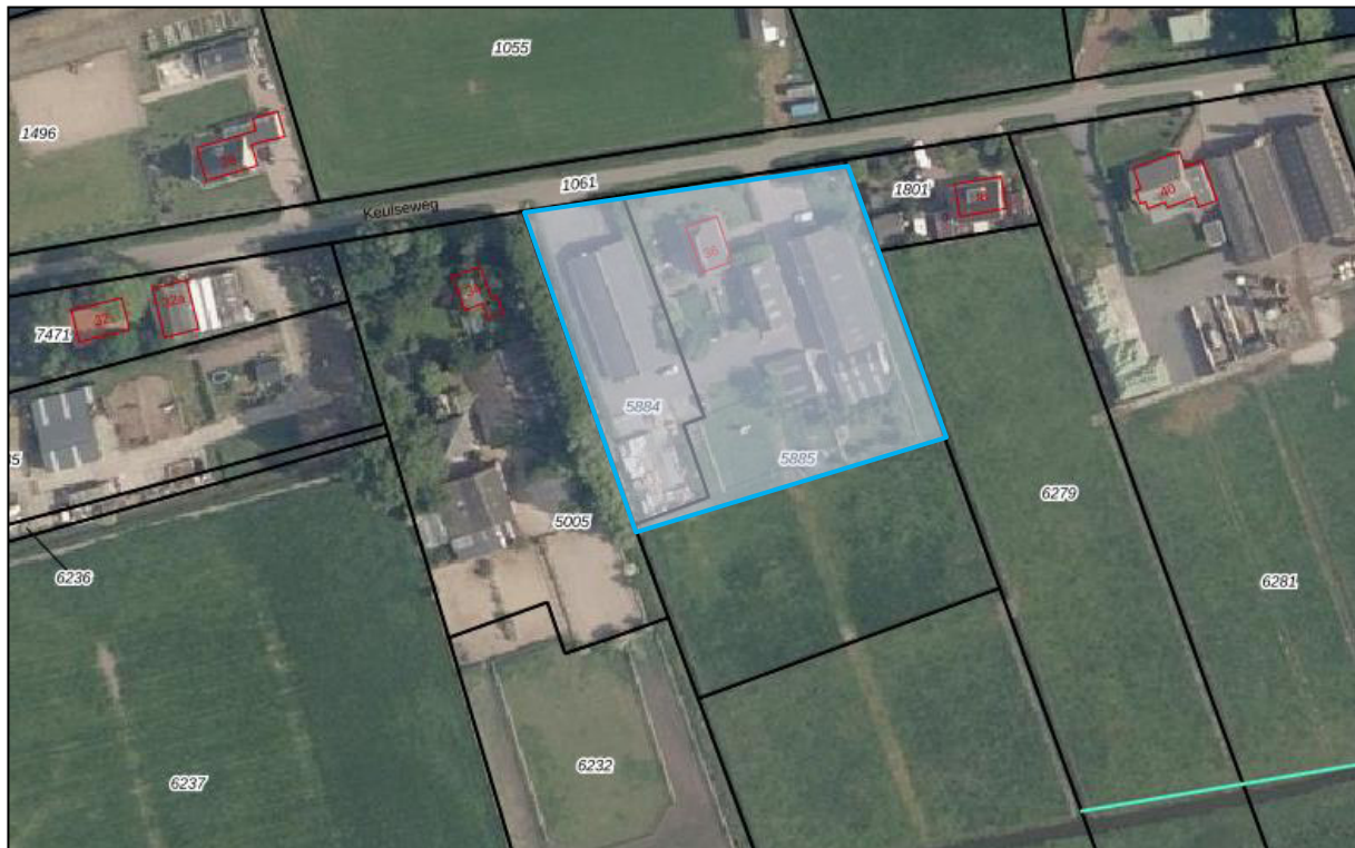
Figuur 1: huidige situatie plangebied (blauw omlijnd)

In opdracht van od205 is een quickscan flora en fauna uitgevoerd ten behoeve van het voornemen om op de locatie Keulseweg 36 te Pijnacker de thans aanwezige opstallen te slopen en nieuwbouw te realiseren. Het plangebied betreft de kadastrale percelen gemeente Pijnacker, sectie B, nummer 5884 en een gedeelte van nummer 5885. Het plangebied heeft een oppervlakte van circa 5.533 m 2 . Op dit moment is het plangebied in gebruik als woonhuis en enkele opstallen met bijbehorend erf.