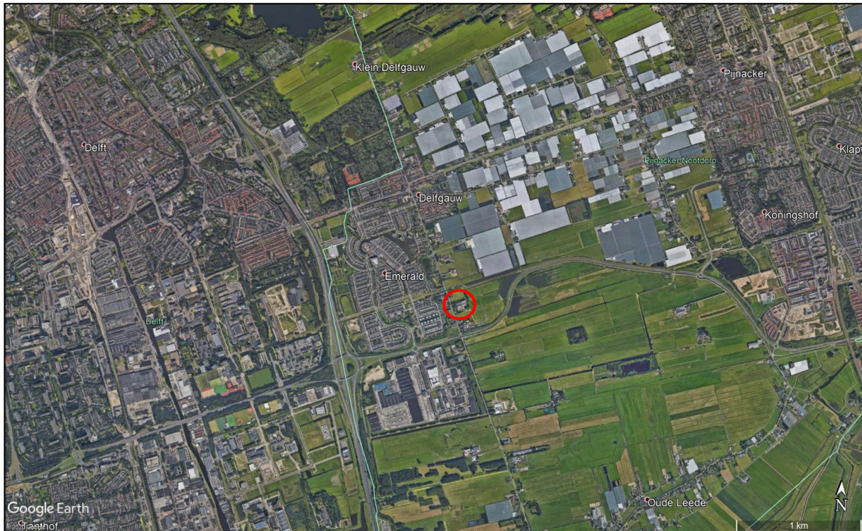
Figuur 2: luchtfoto van de omgeving van het plangebied (rood omcirkeld)

Uit onderstaande luchtfoto (figuur 2) kan worden opgemaakt dat het plangebied aan de rand van de bebouwde kom van Delfgauw is gelegen.