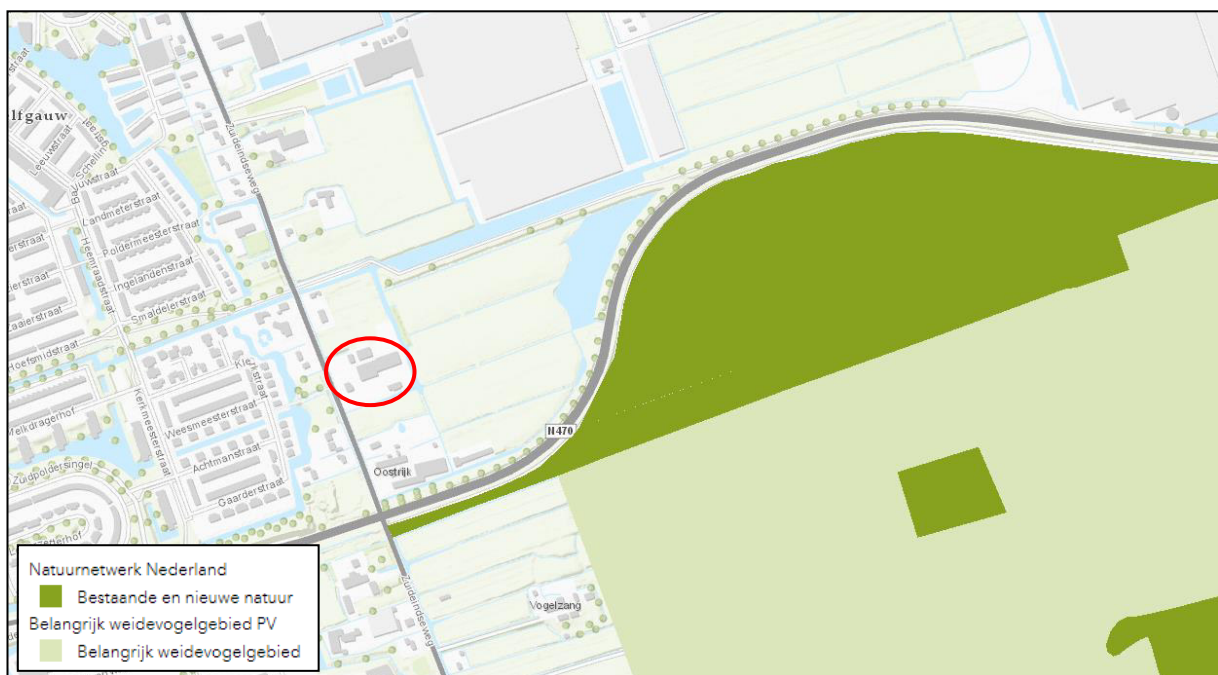
Figuur 4: kaart NNN. Het plangebied en omgeving is rood omcirkeld

In de navolgende figuur 4, overgenomen uit de kaart van het Natuurbeheerplan van de provincie Zuid-Holland is wederom het aandachtsgebied omcirkeld. Ook uit deze figuur blijkt dat het plangebied niet in een beschermd gebied ligt. Het dichtstbijzijnde natuurgebied behorende tot het NNN is op een afstand van circa 200 meter ten zuiden van het plangebied gelegen. Het meest dichtstbijzijnde belangrijk weidevogelgebied is op een afstand van circa 280 meter afstand gelegen.