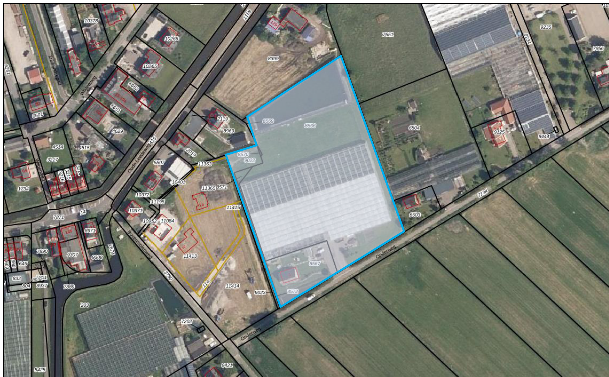
Figuur 1: huidige situatie plangebied (blauw omlijnd)

In opdracht van od205 is een quickscan flora en fauna uitgevoerd ten behoeve van het voornemen om op de locatie Onderweg 1 te Pijnacker de thans aanwezige teeltkassen te slopen en enkele bouwkvelds te realiseren. Het plangebied betreft het kadastrale percelen gemeente Pijnacker, sectie B, nummers 8566, 8567, 8570, 8571 en 9022. Het plangebied heeft een oppervlakte van circa 15.775 m 2 . Op dit moment is het plangebied in gebruik als bedrijfsterrein en weiland.