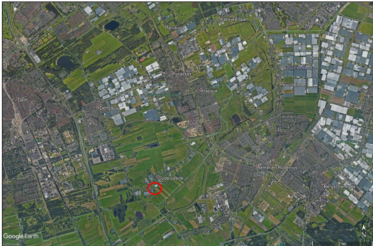
Figuur 2: luchtfoto van de omgeving van het plangebied (rood omcirkeld)

Uit onderstaande luchtfoto (figuur 2) kan worden opgemaakt dat het plangebied in buitengebied van Pijnacker is gelegen.