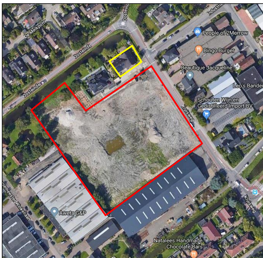
Afbeelding 1: Het braakliggende terrein is rood begrensd en de woning Kruisweg 2 is geel begrensd.