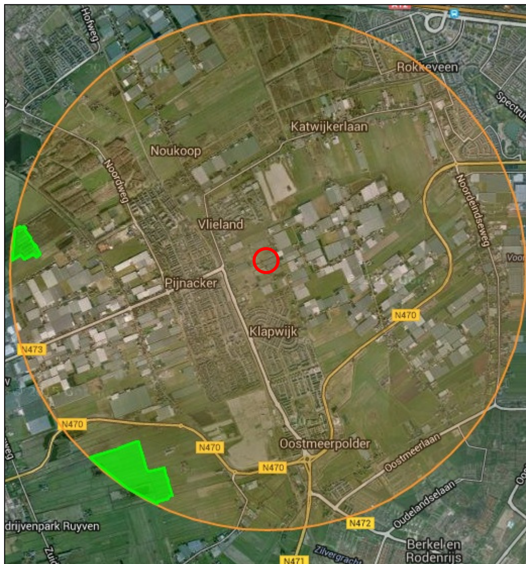
Figuur 2 Plangebied en omgeving met relevante natuurgebieden.

In onderstaande figuur 2 is het plangebied met haar ecologisch waardevolle gebieden in een straal van 3 kilometer in highlights weergegeven. De groene highlights betreffen EHS gebieden.