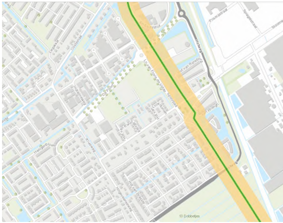
Ligging buisleidingen W-539-05