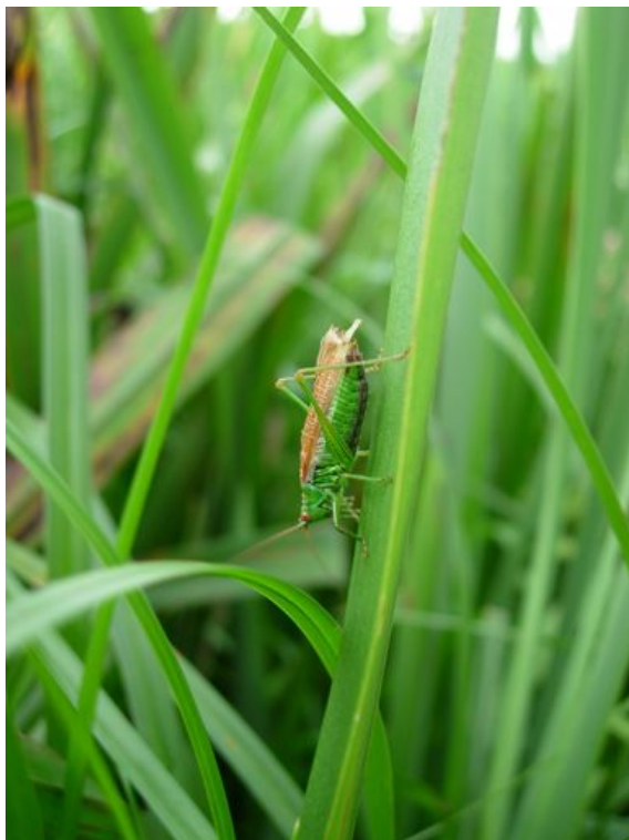
Gewoon spitskopje in moerasruigte aan N470

In 2007 is door Michel Barendse in het nog open gebied ten oosten van Pijnacker in een resthoek met moerasruigte langs de N470 ( x-y=91,0-447,24 ) (een gevleugelde vorm van) Gewoon spitskopje gezien.