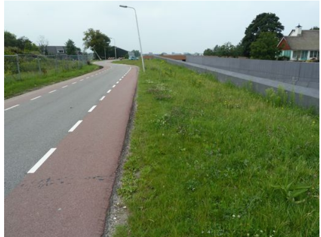
ruige berm langs Middelweg met Smeerwortel en Wilde cichorei schrale berm langs Pastoor Verburghweg met Witte en Rode klaver