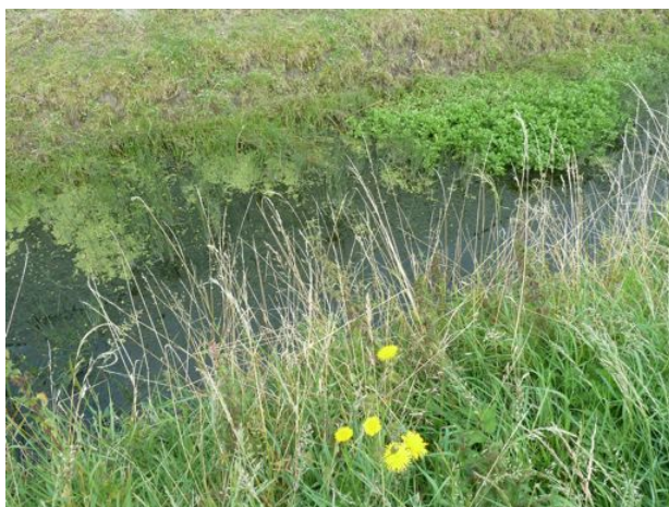
sloot langs Middelweg met Holpipp en Slanke waterkers

Op grond van bovenstaande gegevens mag geconcludeerd worden dat de floristische kwaliteit van het plangebied tussen 1985 en 2011 achteruit is gegaan. Dit komt vooral door het verdwijnen van kritische slootplanten. Dit verdwijnen is eerder het gevolg van de verdere intensivering van het graslandbeheer (inclusief het mechanisch schonen en het aanbrengen van beschoeiing) dan van de verslechtering van de waterkwaliteit.