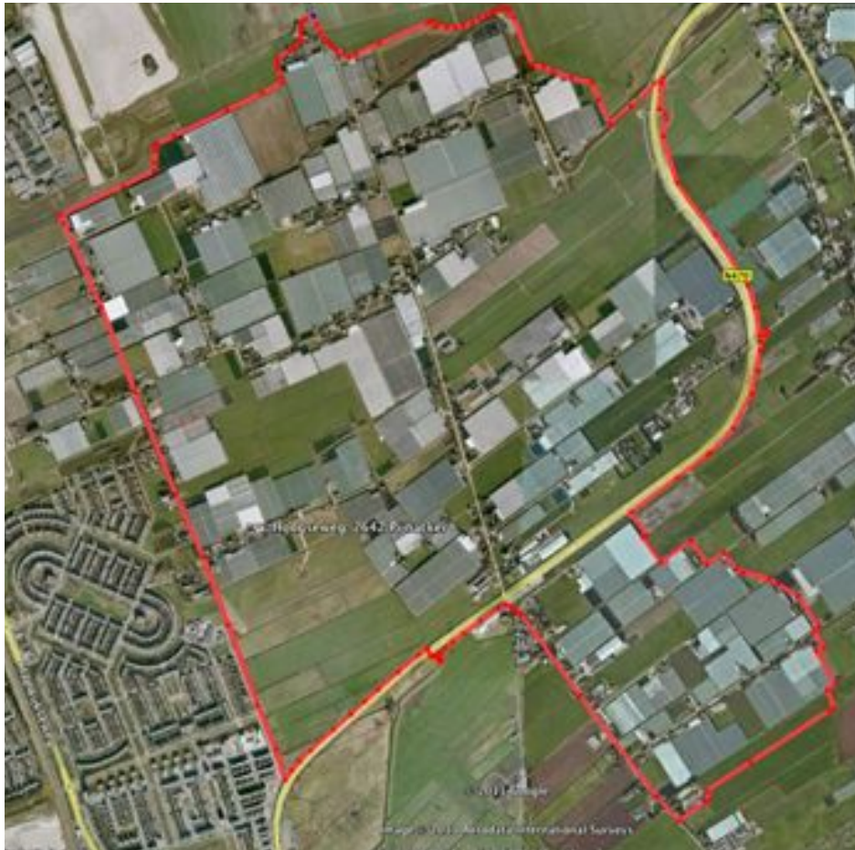
figuur 1: plangebied FES-Oostland

De gemeenten Pijnacker-Nootdorp en Lansingerland zijn gezamenlijk bezig met een nieuw bestemmingsplan voor het buitengebied ten oosten van de kern van Pijnacker met de Kleihoogt/Molenlaan als centrale as (zie figuur 1). In dit plan moet de ambitie van het Fonds Economische Structuurversterking (FES) om de ruimtelijke kwaliteit en economische structuur van het gebied tussen Pijnacker en Berkel te verbeteren worden waargemaakt. Een en ander moet leiden tot de sanering en intensivering van de glastuinbouw, eventuele aanleg van de Oostelijke randweg en ruimte voor waterberging, groen en recreatie.