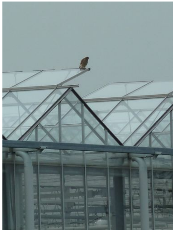
Torenvalk mannetje op kas aan Pastoor Verburghweg