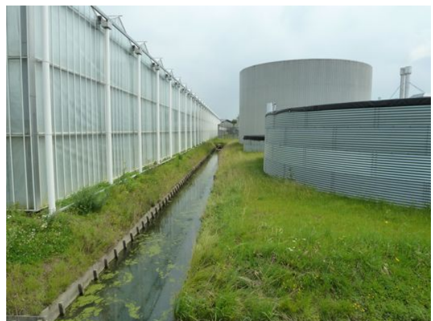
beschoeiide sloot langs Molenlaan met Klein kroos en 'flap'