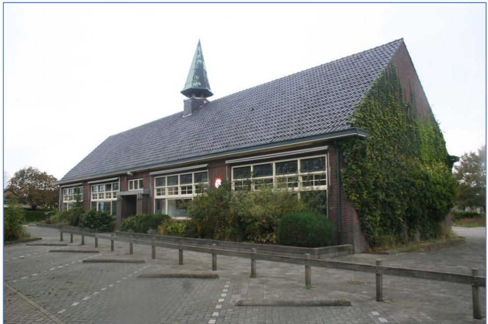
Voormalig schoolgebouw aan de rijderstraat 57 in 't Veld.

Het plangebied is op 23 oktober 2014 bezocht om enerzijds de aanwezige en aangrenzende biotopen te beschrijven en anderzijds eventuele incidentele waarnemingen te doen van beschermde flora en fauna (voor zover waarneembaar). Op basis van de aangetroffen biotopen en informatie uit de vakliteratuur over populaties in de omgeving, is per soortgroep een inschatting gemaakt van het mogelijk voorkomen van in ieder geval die beschermde soorten waarvoor, indien aanwezig, ontheffing moet worden aangevraagd bij werkzaamheden in het kader van ruimtelijke inrichting en ontwikkeling.