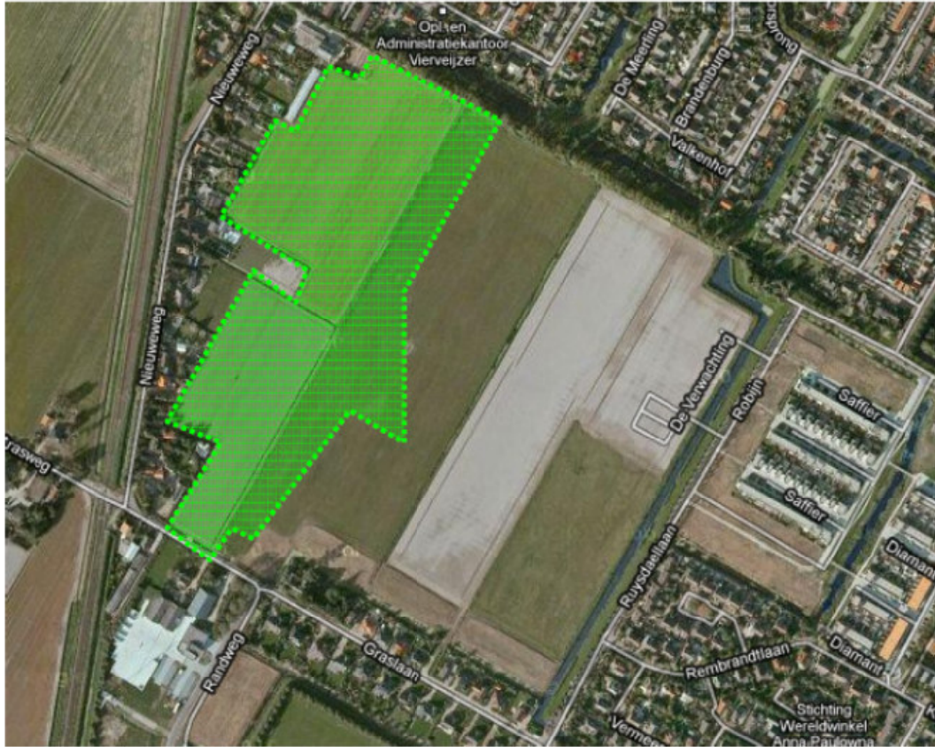
Figuur 1. Indicatieve locatie voor archeologisch vervolgonderzoek (boringen).

Het recente booronderzoek van Grontmij is uitgevoerd worden binnen het 'groen gearceerde gebied van figuur 4' met uitsluitel van het perceel dat niet betreden mocht worden voor onderzoek (6051) (perceel Thunnissen). Omdat de reeds onderzochte zone van De Steekproef ook al is onderzocht door het ADC lijkt ons een derde booronderzoek door Grontmij niet gepast. Beide eerdere booronderzoeken (Steekproef + ADC) tezamen komen in aantal gezette boringen overeen met een karterend booronderzoek. Een karterend booronderzoek omvat doorgaans 10 boringen per hectare. Alsnog het booronderzoek uitvoeren binnen dezelfde zone lijkt ons strijdig met het PvE en het eerder gedane onderzoek en advies van het ADC. Temeer de opmerking in het PvE over het opsporen van archeologische sporen op het veen en omdat aan "het beter in beeld brengen" (overleg 2009) hiermee al is tegemoet gekomen.