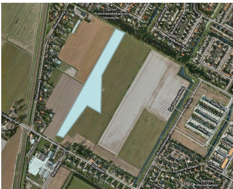
Figuur 3: Mogelijk gebied betreffende sleuvenonderzoek

Voor het overige deel is wellicht nog een sleuvenonderzoek benodigd. Het overige deel is weer-gegeven in figuur 3.