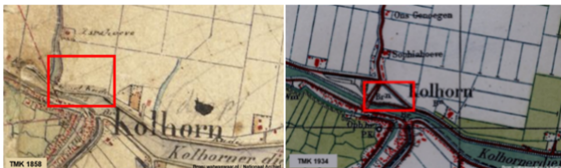
Afbeelding 1 Uitsneden oude kaarten met in rood kader het plangebied

Het oude Kolhorn ligt aan de binnenzijde van de Westfrieze Omringdijk. Deze omringdijk is in de Late Middeleeuwen aangelegd. Tot halverwege de 19 e eeuw lag Kolhorn nog aan de Zuiderzee en maakte het plangebied deel uit van dit water en oeverzone. In 1847 kwam de Waardpolder door inpoldering droog te liggen. De naastgelegen Polder Wieringerwaard (thans in aanblik één landschap) werd al in 1610 ingepolderd. Het plangebied maakte vanaf de inpoldering deel uit van de kade en oeverzone van het kanaal en het Kolhornerdiep. Het terrein bleef lange tijd onbebouwd en maakte tot in de jaren 1930 deel uit van landbouwgronden. Raadpleging van oud kaartmateriaal toont halverwege de jaren 1930 voor het eerst een weg die thans de noordelijke grens van het plangebied vormt. Halverwege de 20 e eeuw wordt het terrein bebouwd en in gebruik genomen voor bedrijvigheid.