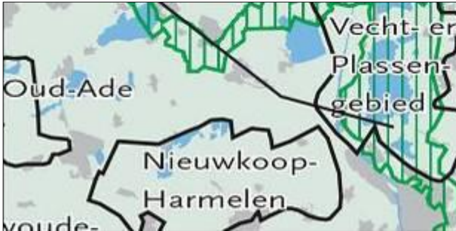
Afbeelding 32 Uitsnede uit de kaart Belvédèregebieden