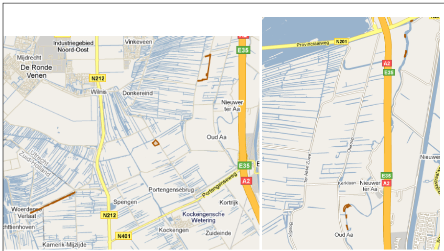
Afbeelding 33 Schraallanden Utrechtwest en Oeverlanden Het Gein (bruin gearceerd)

De Flora- en faunawet biedt een integraal en samenhangend wettelijk kader voor de bescherming van dier- en plantensoorten. Onder meer het soortenbeleid uit de Vogelrichtlijn en uit de Habitatrichtlijn is in de Flora- en faunawet verwerkt. Het gebiedenbeleid van de Habitatrichtlijn en van de Vogelrichtlijn is voornamelijk neergelegd in de Natuurbeschermingswet. In het plangebied liggen geen Natura 2000 gebieden.