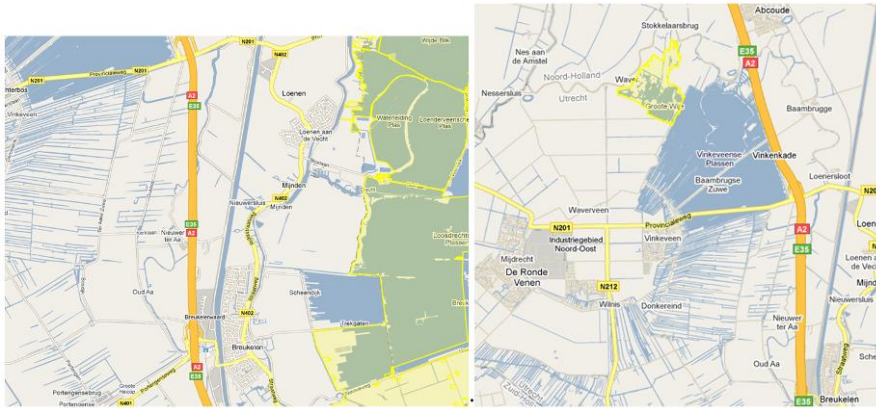
Afbeelding 34 Oostelijke Vechtplassen en Botshol (geel gearceerd), bron: ministerie van LNV