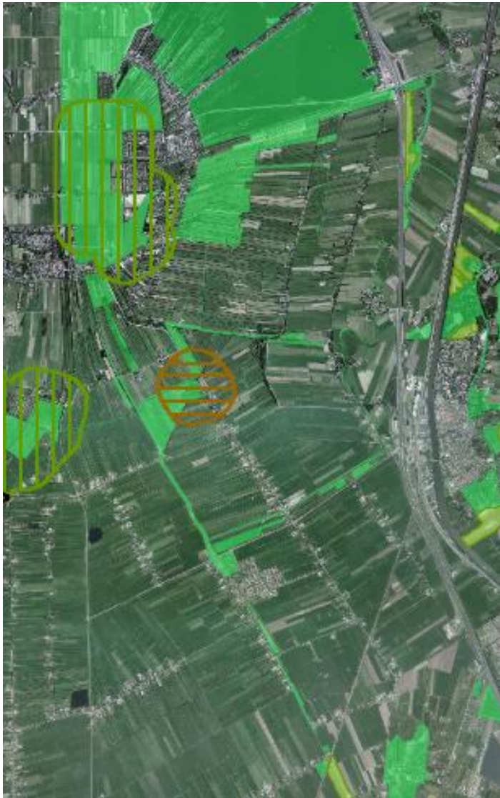
Afbeelding 36 Uitsnede kaart Ecologische hoofdstructuur, PRV

Voor de kwaliteit van de natuur is de Ecologische hoofdstructuur (EHS) van belang.