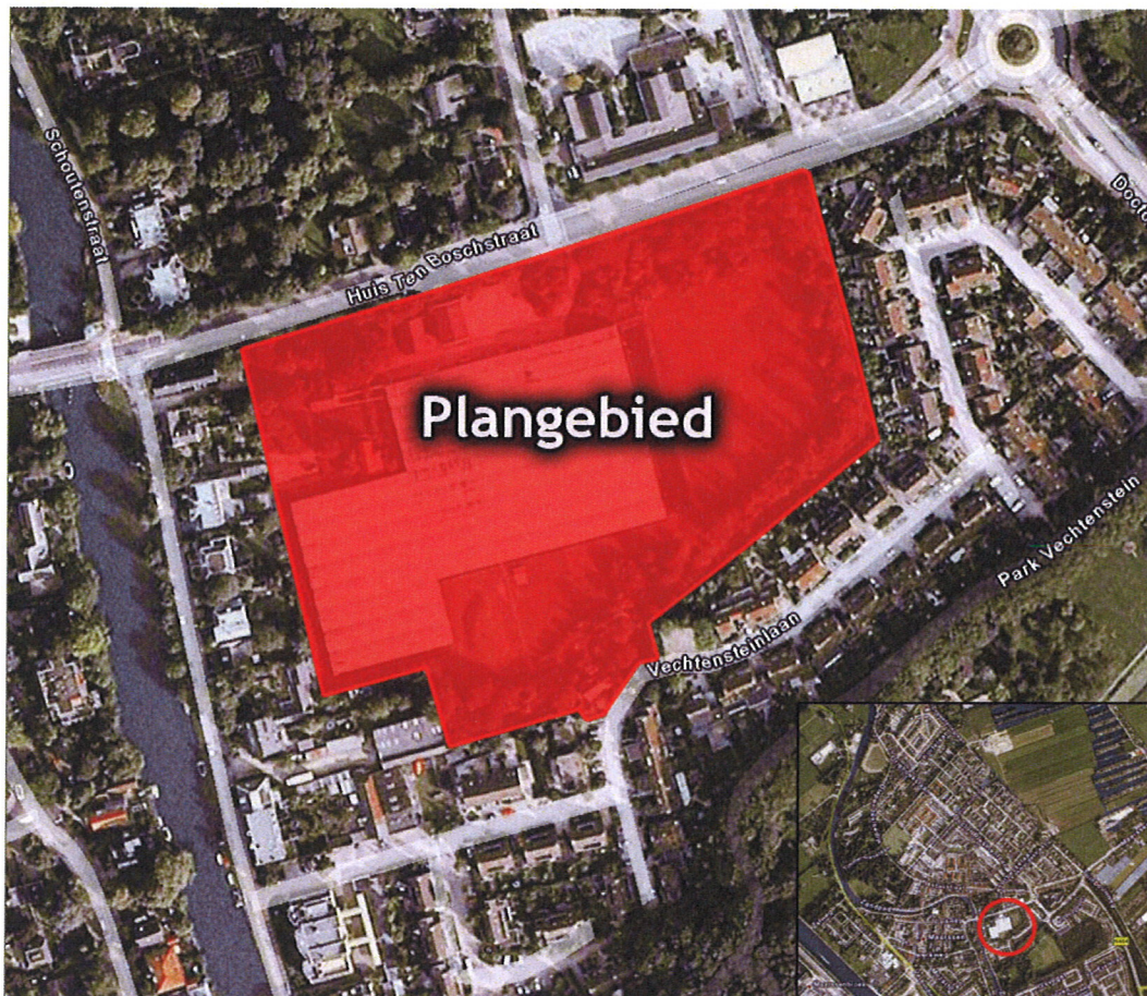
Figuur 1: Luchtfoto ligging plangebied in de kern Maarssen

Het plangebied zelf staat kadastraal bekend als gemeente Maarsseveen, sectie A, nummers 4480, 4499 en 4479 en heeft een totale oppervlakte van circa 3,1 ha, waarvan circa 2/3 bebouwd is met kassen. Het perceel is in de huidige situatie in gebruik als bedrijfslocatie voor kweken van planten en bomen. Ten behoeve van de voorgenomen herontwikkeling zullen de nog aanwezige opstallen gesloopt worden. Figuur 1 toont het plangebied.