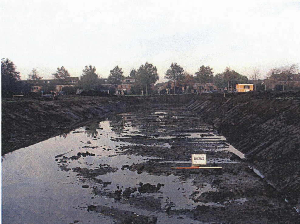
Figuur 2. Nieuw gegraven watergang.

De profielen en vlakken zijn, voor zover dit mogelijk was, geïnspecteerd op de aanwezigheid van archeologische grondsporen en vondsten. Van de sloten en profielen zijn foto's gemaakt.