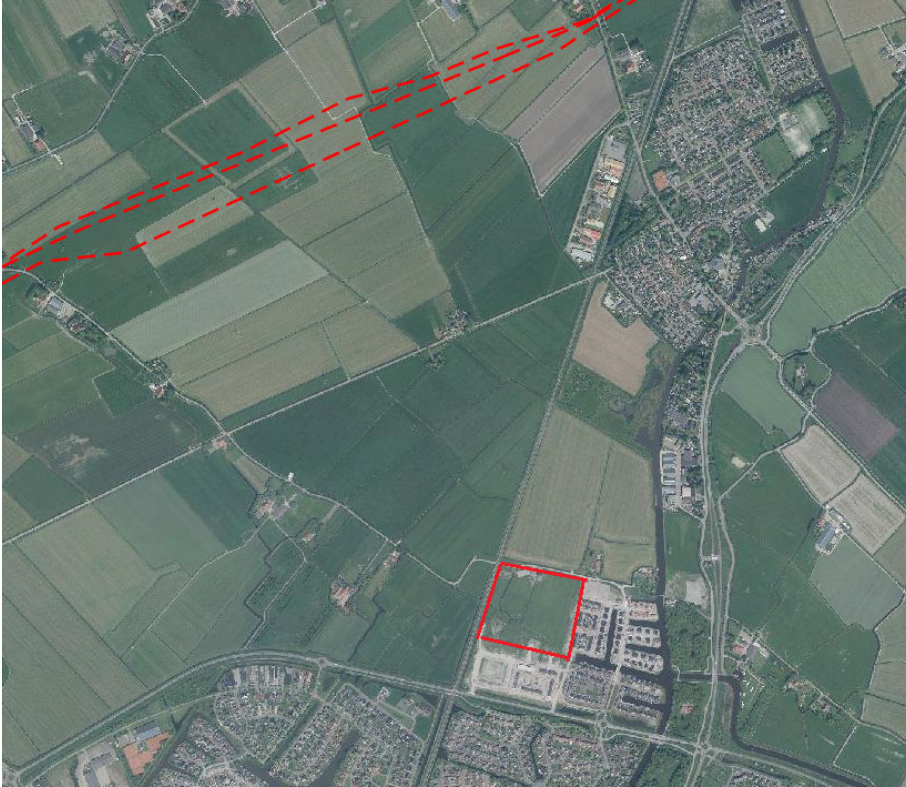
Figuur 2: Plangebied met risicobronnen (Risicokaart) geraadpleegd op 14 juni 2019