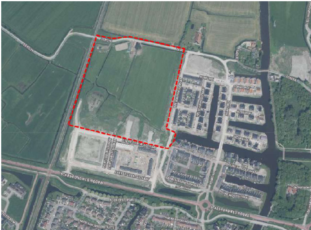
Figuur 1: Ligging plangebied

De ligging van het plangebied is figuur 1 weergegeven.