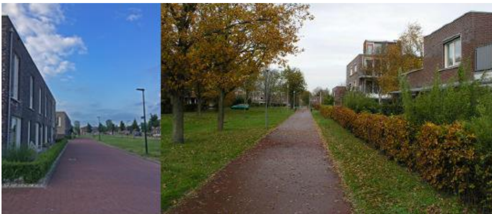
Bestratingsmateriaal in terughoudende kleuren; groene erfafscheidingen; open en groene bermen; forse opgaande beplanting