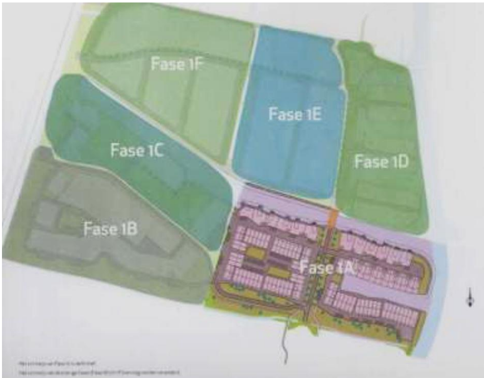
Figuur 2. Fasering fase 1 van het Harinxmaland bij Sneek

Harinxmaland betreft een nieuwe woonwijk aan de noordzijde van de rondweg van Sneek. Fase 1 van Harinxmaland is verdeeld in meerdere delen (zie volgende figuur), waarvan de fasen 1A, 1D en 1E ontwikkeld zijn of in ontwikkeling zijn. Fase 1B is de eerstvolgende te ontwikkelen fase.