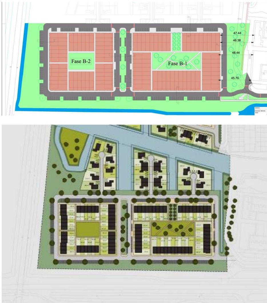
Figuur 3. Indicatieve verkavelingsvoorstellen