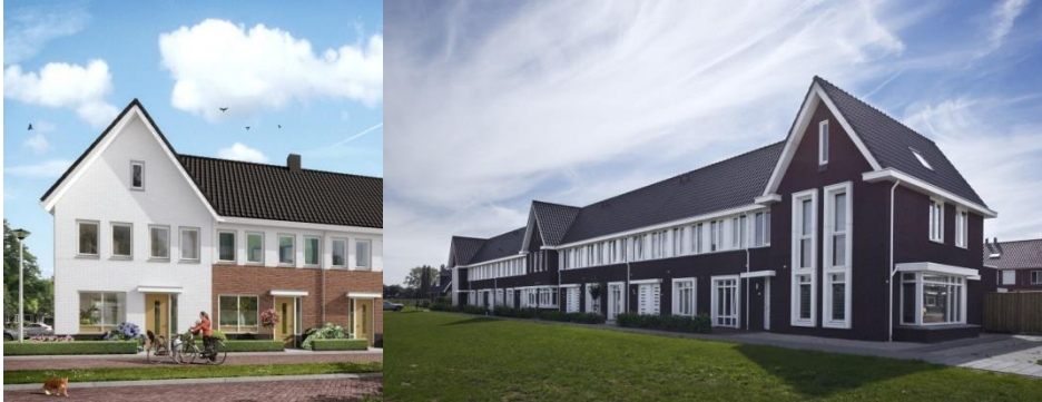
Accenten doormiddel van een dwarskap