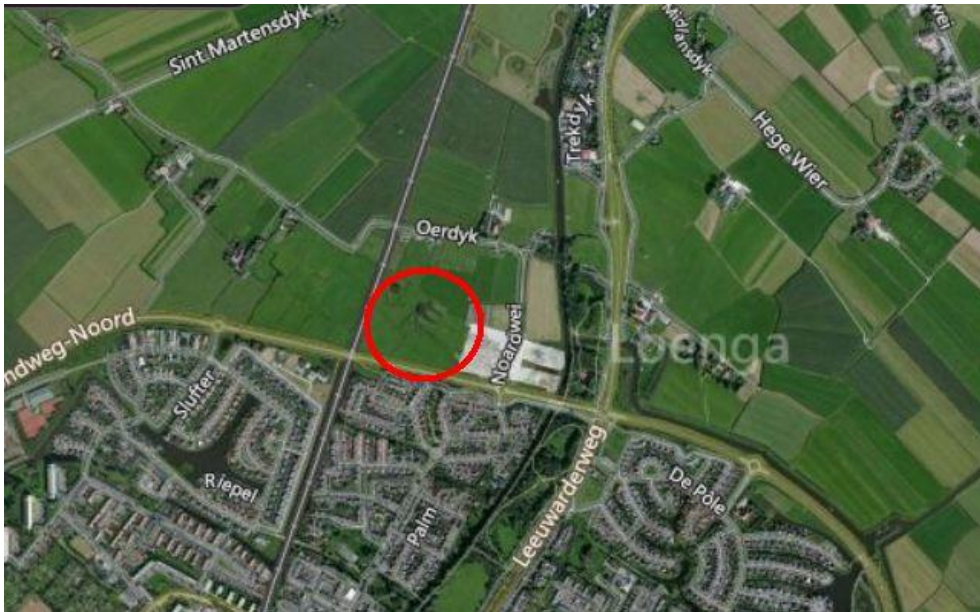
Figuur 1. Globale ligging fase 1B Harinxmaland

Harinxmaland is een nieuwe woonuitbreiding aan de noordkant van Sneek. De wijk wordt gefaseerd aangelegd. Dit beeldkwaliteitplan heeft betrekking op Harinxmaland fase 1B. Het gebied ligt globaal tussen de rondweg en het dorp Scharnegoutum. De ligging van dit gebied is in de volgende figuur aangegeven.