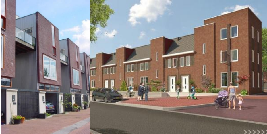
De massaopbouw langs het spoor is hoger en afwijkend; links kopgevels in afwijkend metselwerk; rechts een hoekaccent