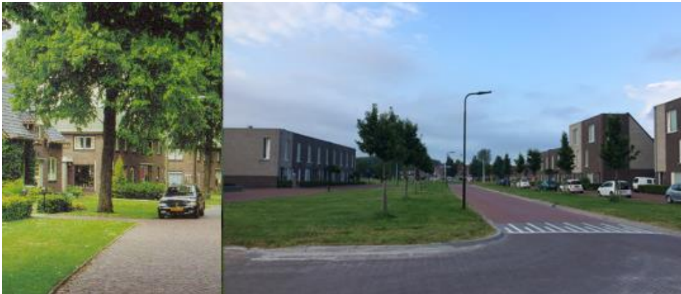
Groene erfafscheidingen; open en groene ruimte; forse opgaande beplanting