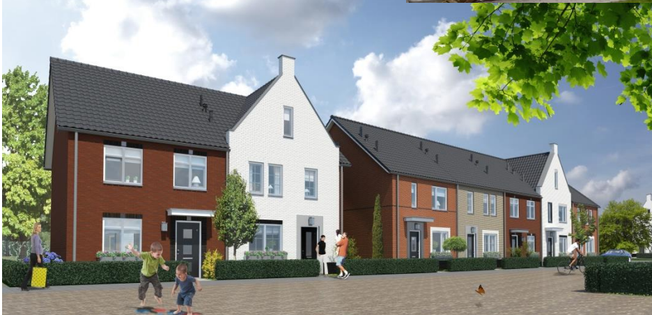
Donker metselwerk voor de basis en lichter metselwerk voor de accenten/kopgevels